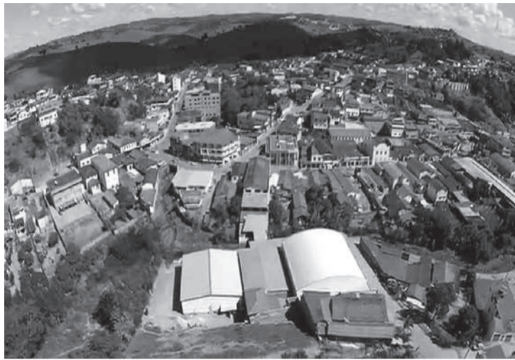
Santa Maria do Suaçuí, em Minas Gerais, cidade onde está localizada a sede do CISVAS

gência de certificado do Ibama em nome do fabricante pode, sim, impedir a participação de empresas que forneçam produtos de fabricação estrangeira, devidamente importados para o país, mas cujo fabricante não possua registro no CNPJ. Assevera que esse tratamento diferenciado não se justifica, uma vez que “o importador de pneus e o fabricante possuem responsabilidade ambiental e é obrigatória sua inscrição no cadastro técnico federal de atividades potencialmente poluidoras e utilizadoras de recursos ambientais”.