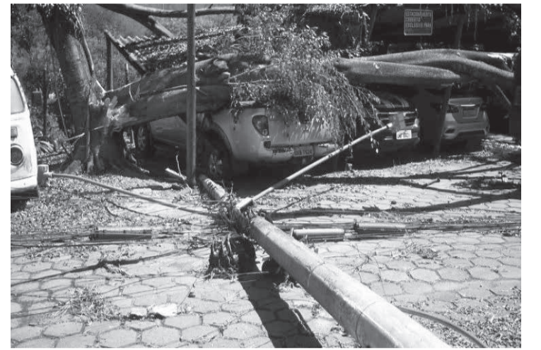
Mais de 50 ocorrências registradas; ao lado da PRF, na BR 116 caiu uma árvore e um poste

Expo-Aventureiro no Campeonato - Com a confirmação do período em que acontecerá a 36ª Exposição Agropecuária e Concurso Leiteiro de Santo Antônio do Aventureiro, entre os dias 13 e 17 de setembro, está definida para o dia 17, a realização de provas do Campeonato da Zona da Mata de Motocross que acontecerá naquela que é considerada como uma das melhores e mais competitivas pistas de modalidade esportiva de toda região. A 36ª Exposição Agropecuária e Concurso Leiteiro