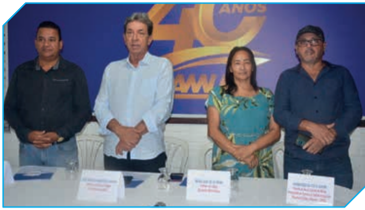
Mesa Diretora dos trabalhos durante a LXXVII Assembleia Extraordinária (emergencial) da AMUC, na terça-feira (29/8)