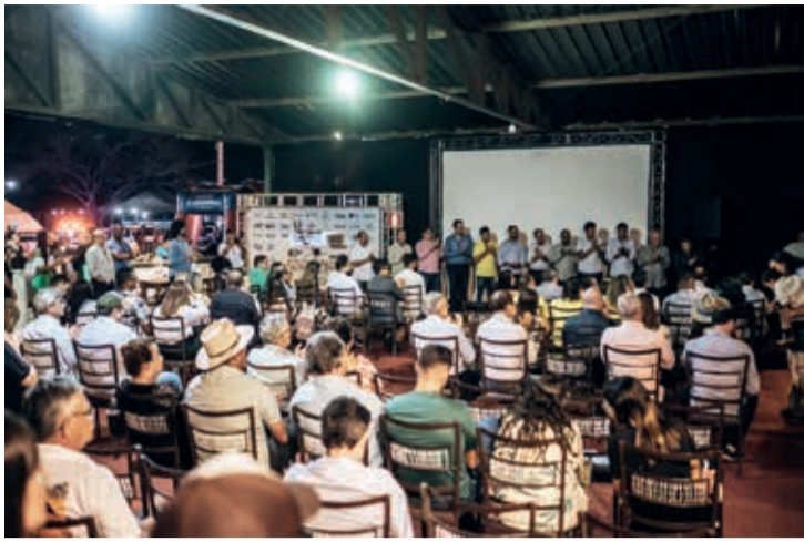
Abertura oficial da Expovales 2023, na noite de quinta-feira (24)