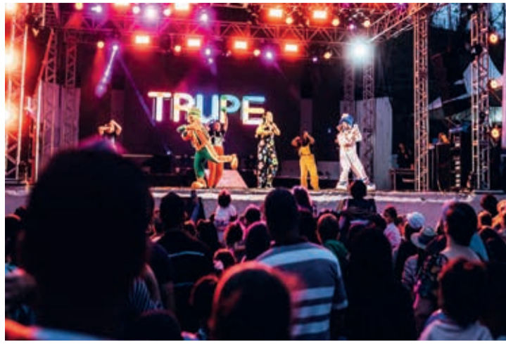
Trupe, shows para a criançada, na tarde de domingo (27)