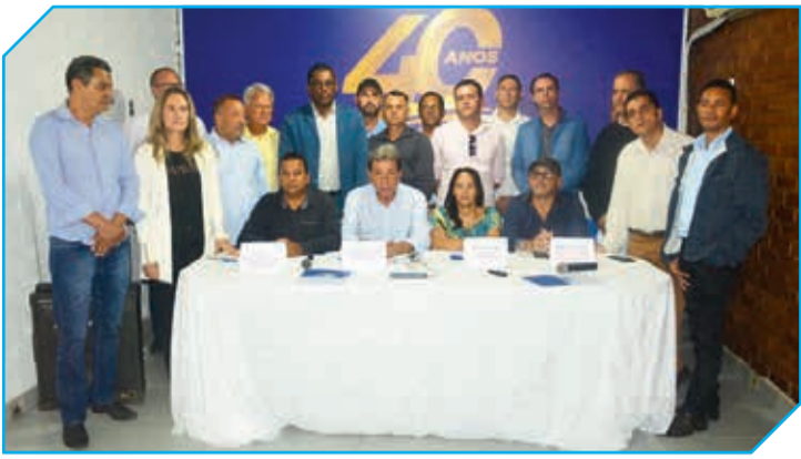
Na Assembleia prefeitos decidiram tomar medidas emergenciais para solucionar juntos os problemas dos seus municípios