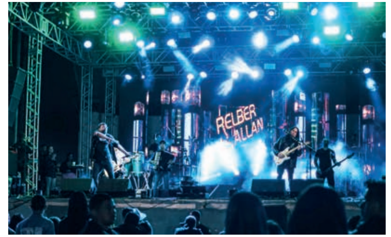
Show com Relber e Allan animou a Expovales, na noite de domingo