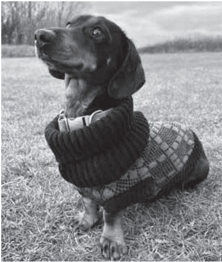
Moda para os pets: Wag & Wool

taques nesse quesito como, Snoot Style, Canadá Pooch, Beana Design, Cloud 7, Wag&Wool, Kali Dog Wear e Kizzou. Há também aquelas especializadas em acessórios (coleiras, laços, sapatinhos, etc.) que foram relacionadas, como, a Omnia-gioia, Bonne et Filou e Meomari. Fazem verdadeiras jóias. E tem mais: existe até uma linha de 'alta-costura' para os pets, sendo lembradas marcas tais como, Holly Owl, Eva Machi, UnoRuben e LolliPet. No Brasil, existem inúmeras pequenas marcas trabalhando com a chamada dogwear. Um segmento que cresce e aparece, cada vez mais, na lista de gastos com esses novos membros das famílias modernas.