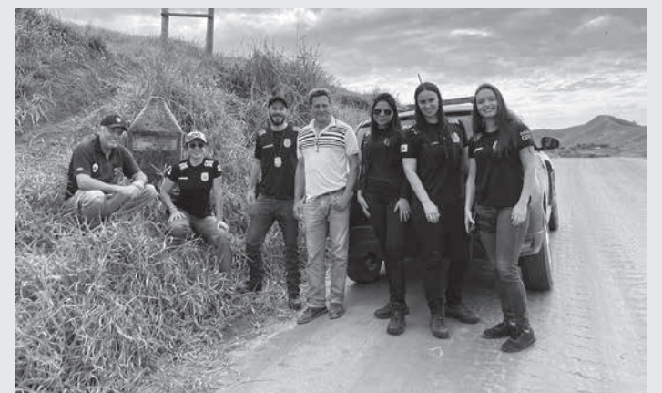
Batista. Escrivão: Frederico dos Santos. Investigadoras: Letícia Mascarenhas, Camila Schaper e Caroline Lopes. (Informações/Fotos: assessoria de comunicação da PCMG/ Nanuque).