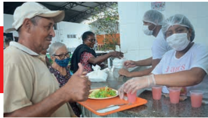
Refeição é balanceada e vem acompanhada de suco e sobremesa