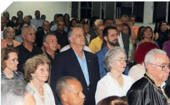
O auditório, onde o evento foi realizado, estava lotado pelos homenageados acompanhados por seus familiares, amigos e demais convidados