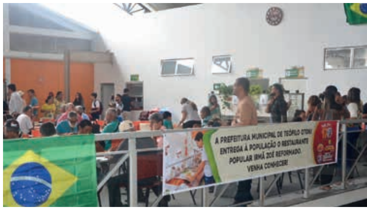
O restaurante popular "Irmã Zoé" foi reformado e reestruturado