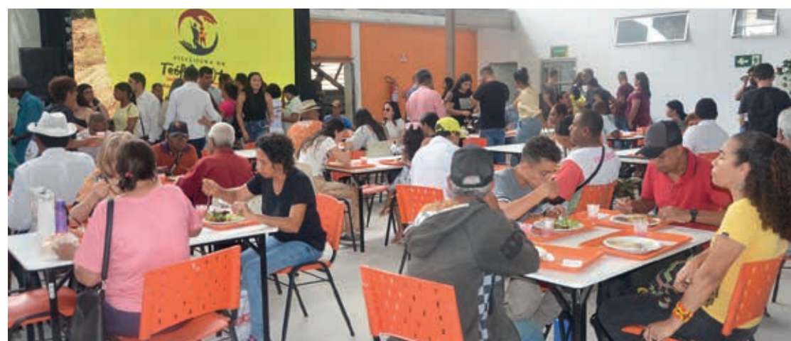
O Restaurante Popular "Irmã Zoé" está localizado dentro do Mercado Municipal