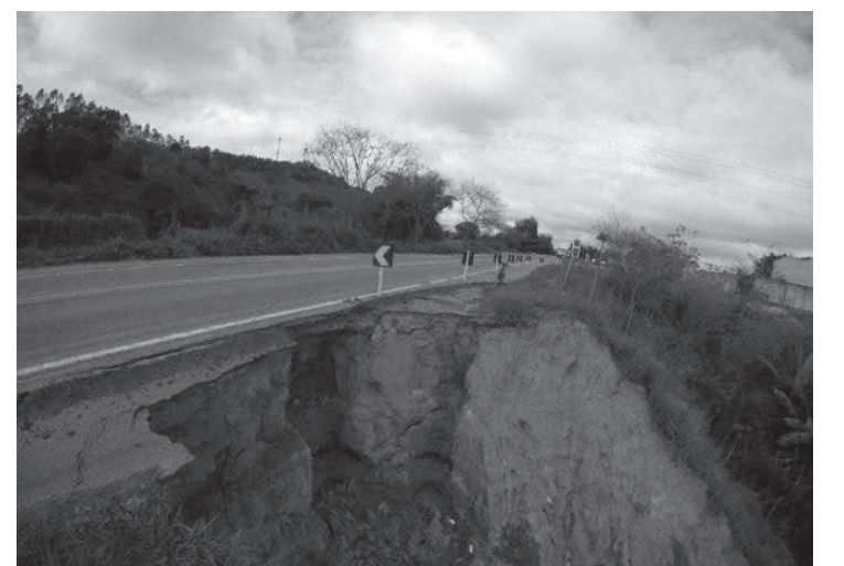
A expectativa do Departamento Nacional de Infraestrutura de Transportes é iniciar os reparos na cratera na rodovia no próximo mês

Erosão na BR-458 continua sem reparo - Uma erosão que se formou em janeiro do ano passado, na margem direita do Km 133, da BR-458, entre Caratinga e Ipaba, continua sem reparo. Localizada perto do posto Beira Rio, entre a entrada para a Lagoa Silvana e o trevo de acesso a Ipaba e a cratera já atingiu a base da pista de rolamento. A situação preocupa porque o trecho pode ser interditado com a expansão da cratera. E apesar da notória urgência por uma intervenção, o problema ainda não foi resolvido, pelo contrário, só aumenta, literalmente, pois o buraco está cada vez maior. (Diário do Aço - Ipatinga)