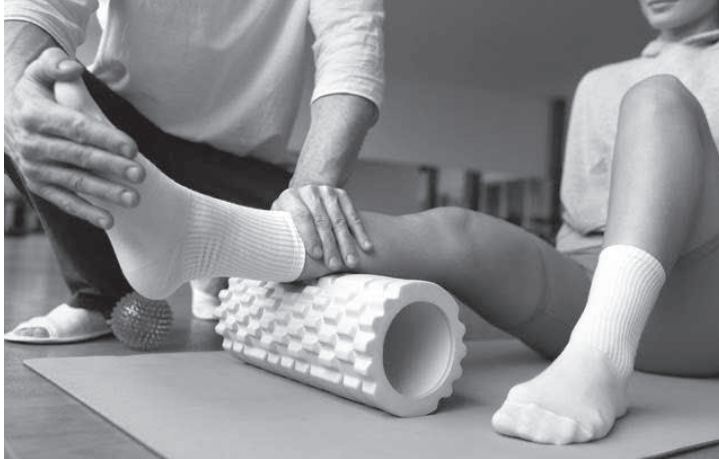
Municípios alegam dificuldades para pagar o piso da fisioterapia

A CNM solicitou, em ofício encaminhado aos deputados, que o tema seja debatido com cautela, e afirmou que “vê com preocupação a instituição dos pisos salariais em tramitação nesta casa legislativa, que têm como consequência impacto financeiro significativo aos Municípios”. A Confederação ainda destacou que os repasses de recursos da União para os Municípios “já não refletem