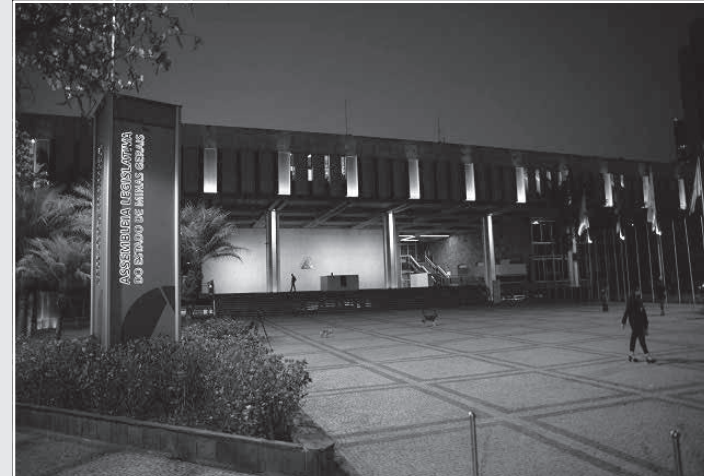
O Palácio da Inconfidência ficará iluminado de amarelo deste domingo (10/9) até a próxima sexta (15/9)

Desde 2015, a ALMG apoia a campanha "Setembro Amarelo", liderada por instituições como a Associação Mineira de Psiquiatria (AMP), Associação Brasileira de Psiquiatria (ABP), Conselho Federal de Medicina (CFM) e Centro de Valorização da Vida (CVV).