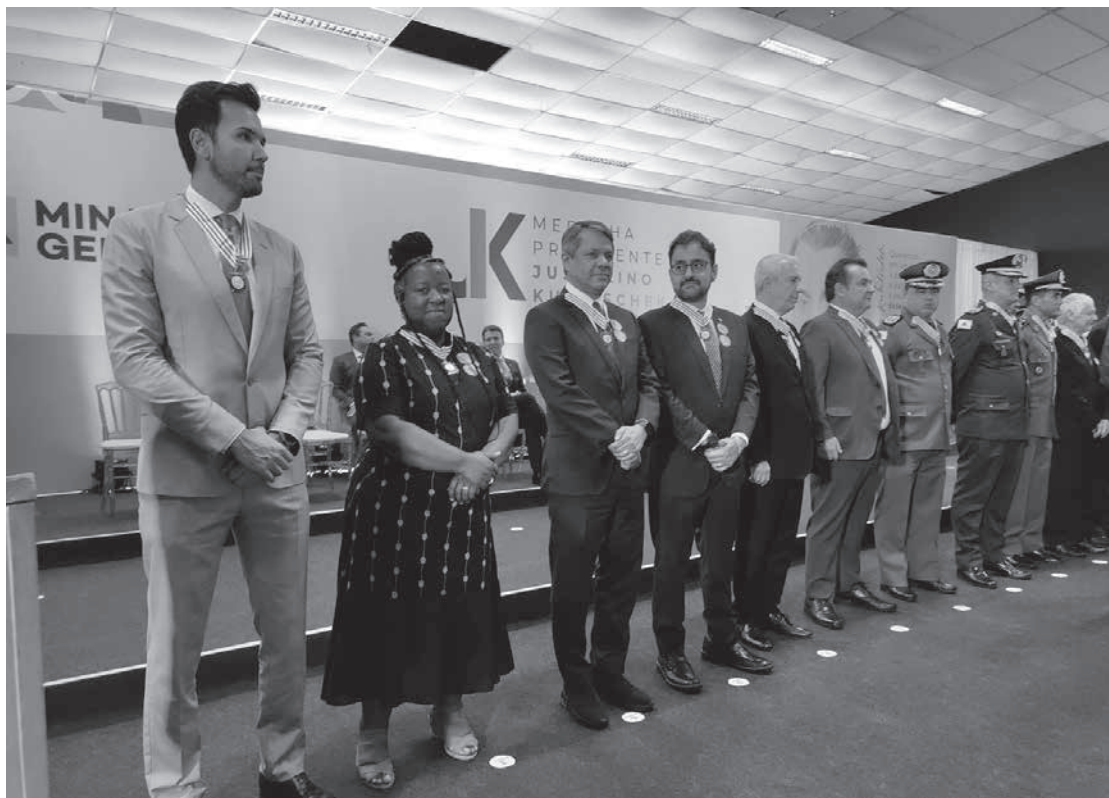
Durante a solenidade, o presidente da ALMG foi convidado a hastear a Bandeira do Brasil

Atividades do evento vão até sexta (15) em comemoração ao Dia do Ministério Público, celebrado neste dia 11 de setembro