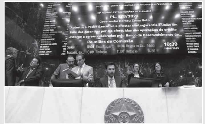
O empréstimo internacional ao Estado foi aprovado na manhã desta quarta (13), em Reunião Extraordinária de Plenário

O texto foi aprovado na forma original, conforme parecer da Comissão de Fiscalização Financeira e Orçamentária (FFO). O PL 878/23 autoriza o Poder Executivo a oferecer à União contra garantia ao empréstimo, constituída pela