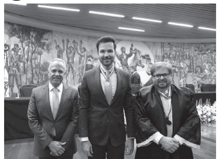
Presidente da ALMG recebe Colar do Mérito da Corte de Contas Ministro José Maria Alkmim