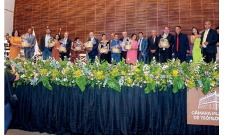
Os homenageados também receberam uma cesta de presente