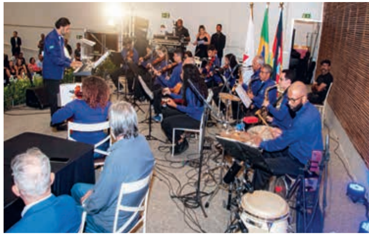
A Orquestra Nosso Mucuri foi muito aplaudida por todos