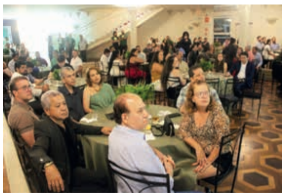
Em primeiro plano, diretores e conselheiros da ACE no auditório do Automóvel Clube, que sediou o lançamento da EXPONOR