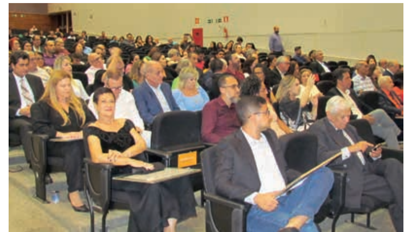
Solenidade histórica da Câmara com 36 pessoas homenageadas