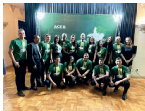
A Equipe ACE comemorando o sucesso do coquetel de lançamento da EXPONOR 2024, mais de 70% dos estandes vendidos