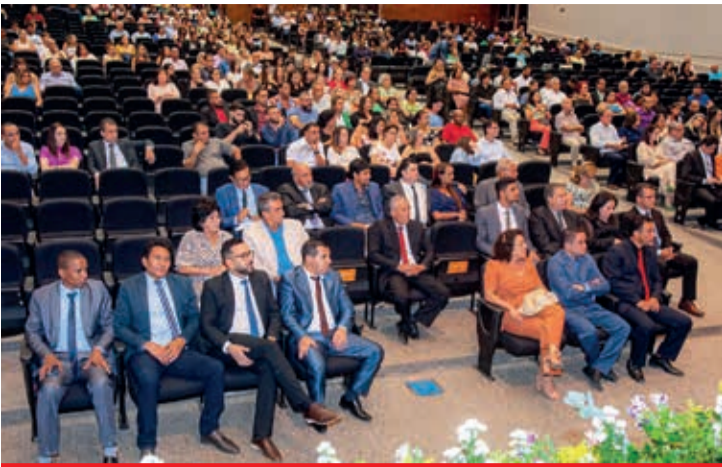
Solenidade realizada no Centro de Convenções – Expominas, em Teófilo Otoni, na noite de quinta-feira (21/9)