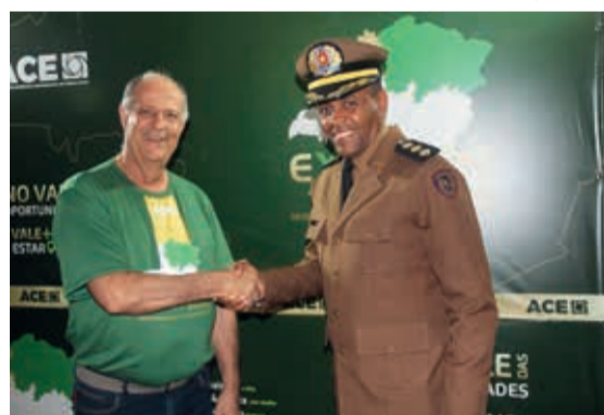
O presidente da ACE cumprimenta o Coronel Heleno, comandante da 15ª Região de Polícia Militar e um dos expoentes da segurança pública