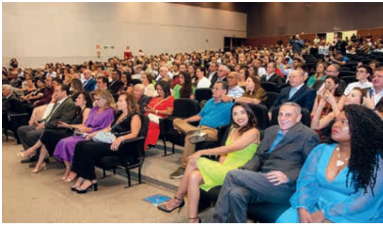
Familiares e amigos prestigiaram os homenageados