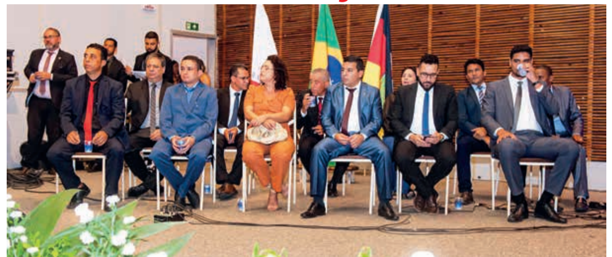
Veredores da atual legislatura na solenidade no Expominas, em Teófilo Otoni

P ela primeira vez na história, a Câmara Municipal de Teófilo Otoni realizou uma solenidade com 36 homenageados. A cerimônia aconteceu na noite de quinta-