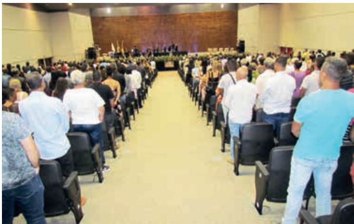
Solenidade realizada no Centro de Convenções - Expominas