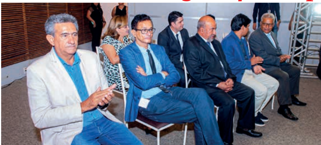
Ex-vereadores participaram da entrega dos títulos aos 36 homenageados

As homenagens fazem parte das comemorações do 170º aniversário da cidade