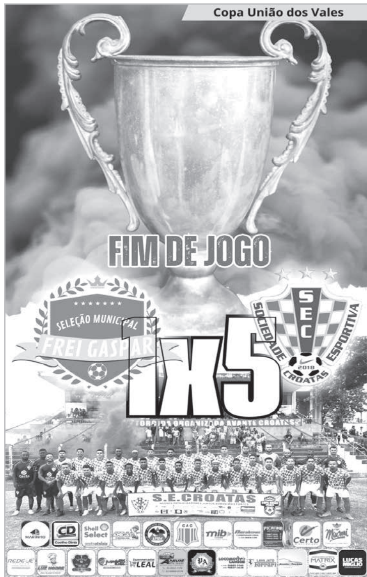
Croatas campeão da 9ª Copa União dos Vales

Os dois finalistas da Copa União dos Vales foram o Frei Gaspar e o Croatas de Teófilo Otoni. O time da Turma 37, também de TO, saiu na fase de classificação. A festa esportiva de Frei Gaspar foi muito prestigiada pela comunidade, inclusive pelo prefeito Edson Alves que se empenhou para que a reforma do estádio saísse a tempo. Nada menos