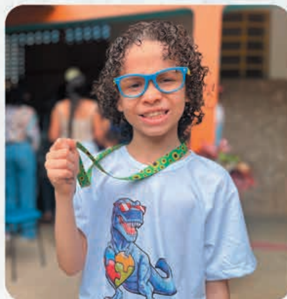
Mais inclusão com a criação do cordão de girassol