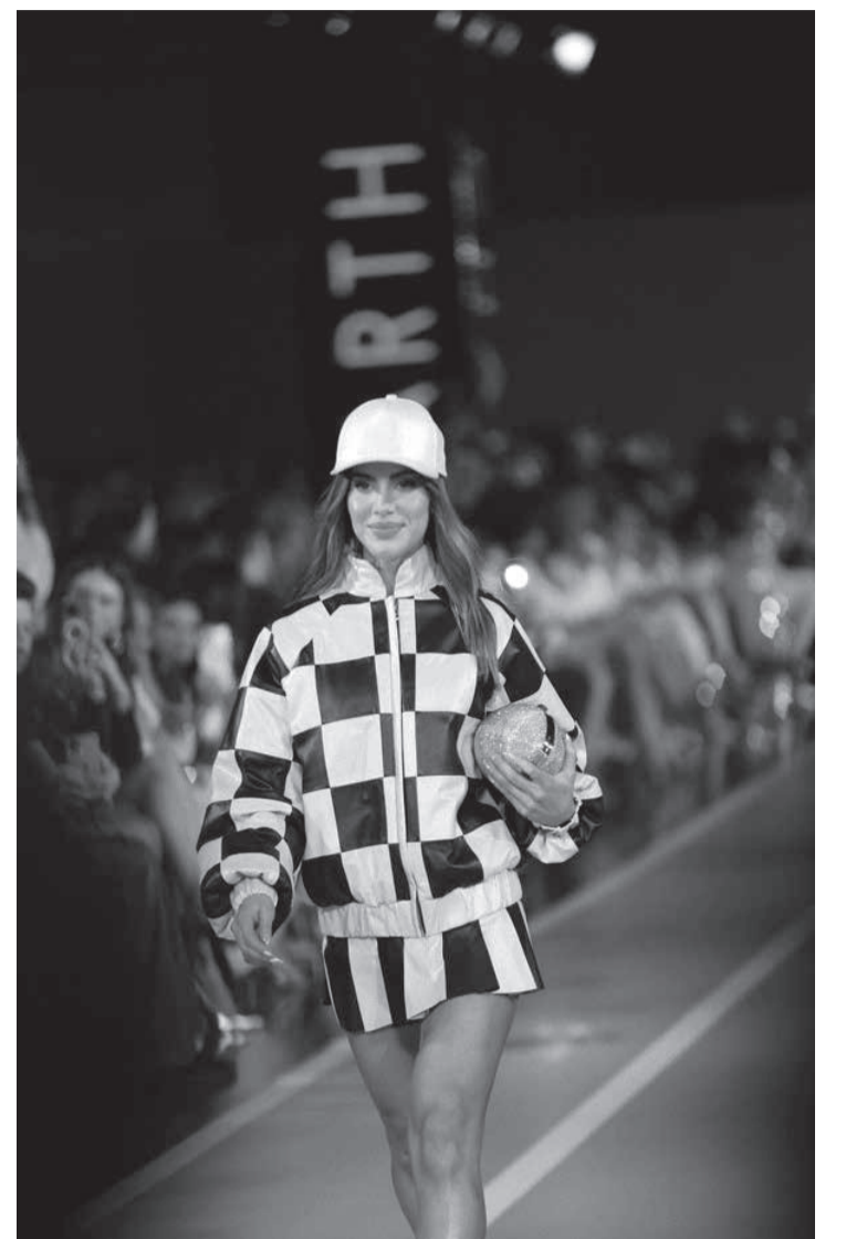
O desfile da Charth em SP

No São Paulo Fashion Week (realizado no Complexo Tempo) a novidade foi o público com ingresso pago. Parece que deu certo. Já os desfiles, somaram 40 grifes de todo o país, com destaque para os novos nomes. O evento tem, ainda, um marketplace para realizar vendas das marcas participantes. Agora, inicia a pausa de fim-de-ano, mas tudo recomeça em janeiro, quando será realizada a Couromoda, também em SP, com lançamentos inverniais em acessórios.