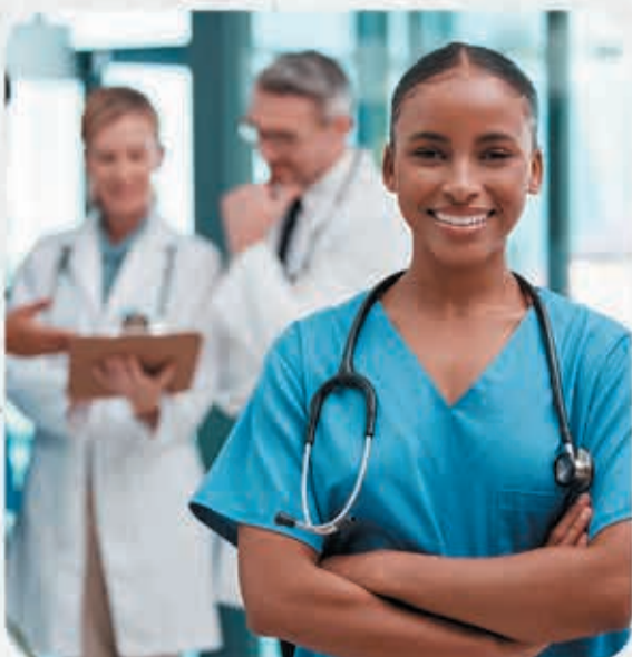
Piso da enfermagem aprovado