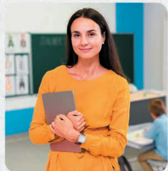
Piso dos profissionais da educação aprovado