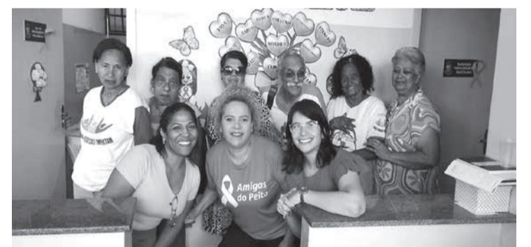
Atividades no PSF Filadélfia alusivas à campanha “Outubro Rosa”, com programações muito importantes para os cuidados com a saúde da mulher