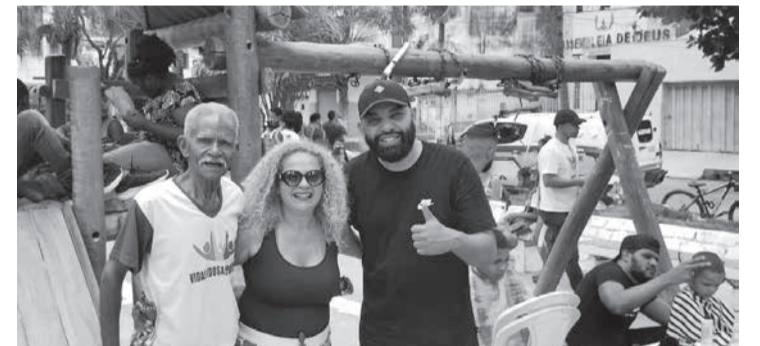
Os idosos participaram de um evento na avenida João XXIII, bairro Manoel Pimenta, alusivo ao dia das crianças, com muitas atrações, guloseimas, e muita animação