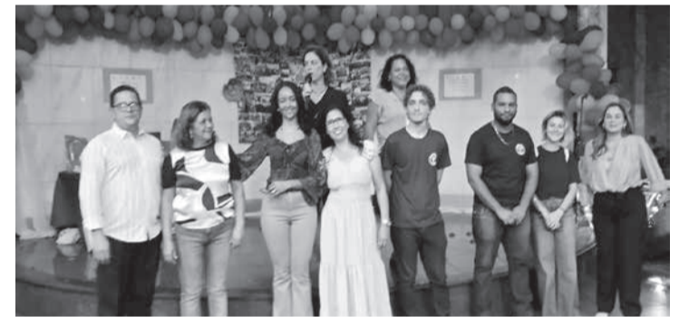
Dia dos talentos da terceira idade, através do projeto dos acadêmicos do curso de psicologia da AlfaUnipac, com várias atrações como, poesia, música, e o desfile da longevidade