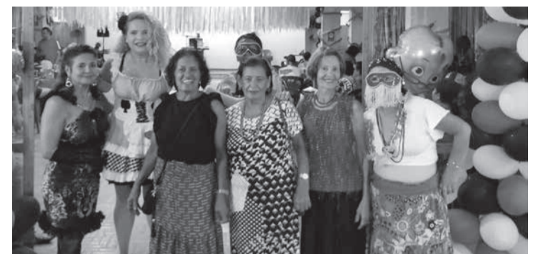
O Baile da Fantasia da Terceira Idade, foi realizado no Clube Libanês, em Teófilo Otoni, pelo grupo Hidro-Idade e a Associação Amigos da Terceira Idade (AATI)