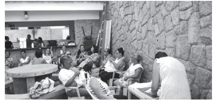
Realização de atividades de artesanatos, forró e grupo musical, durante todas as quartas-feiras à tarde, no espaço do antigo Sesc, hoje o Casarão da Cultura