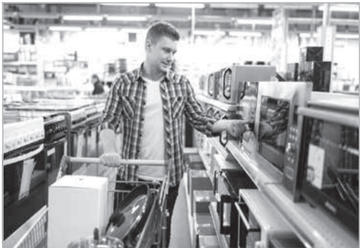
Economia Black Friday

Quase 70% dos brasileiros têm interesse em adquirir um equipamento eletrônico na ocasião, segundo pesquisa