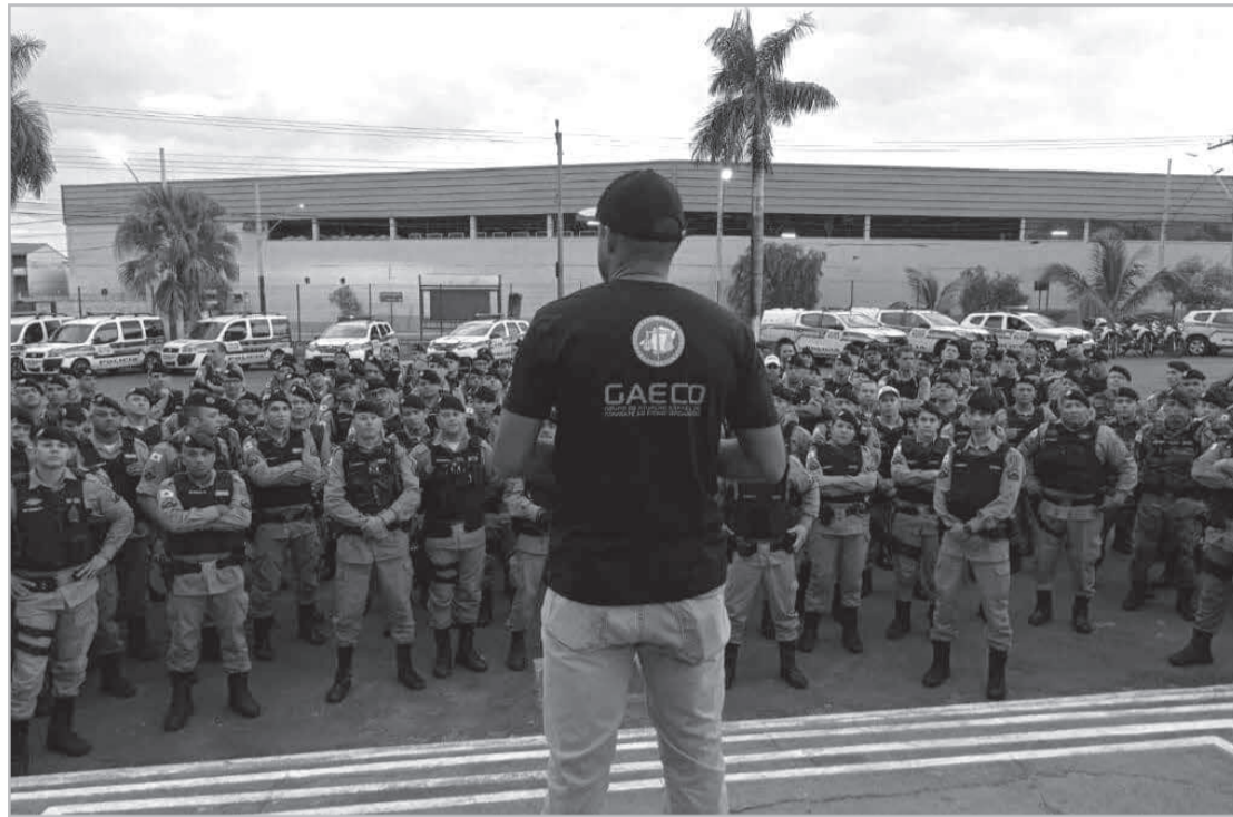
Gaeco e Polícia Militar realizam operação de combate ao jogo do bicho, agiotagem e lavagem de dinheiro (Divulgação)

Pesquisas incrementam a cadeia do queijo - Nos últimos cinco anos, a Fundação de Amparo à Pesquisa do Estado de Minas Gerais (Fapemig) investiu mais de R$18,3 milhões em pesquisas sobre o queijo e, como resultados, surgiram produtos de maior qualidade e competitividade. “Sem dúvida nenhuma, a ciência trouxe para nós, produtores, mais conhecimento. A tecnologia que foi empregada no queijo realmente tem impacto direto na qualidade do nosso produto. E isso não envolve só a produção em si, mas toda a cadeia”,