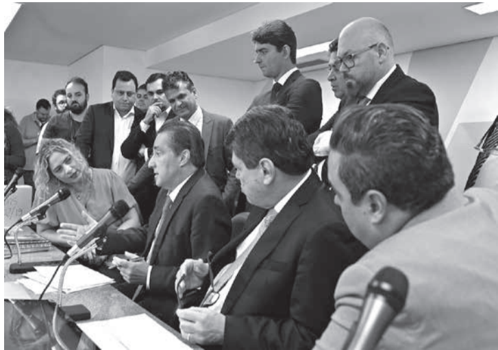
Projeto de Lei 1.202/19 foi debatido na Comissão de Fiscalização Financeira e Orçamentária

Projeto de autoria do governador recebeu 1.633 emendas na comissão e foi criticado por diversos parlamentares, em reunião na quinta-feira (30/11)