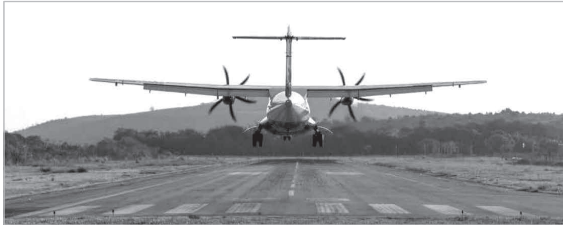
A partir de agora começa o período de transição operacional com administração integrada entre os dois órgãos

Decreto protege árvores em JF - Em Juiz de Fora oito árvores estão protegidas por decreto e não podem ser cortadas? Cada decreto municipal protege uma árvore em específico. As normas foram publicadas ao longo de 1978 e 2006. Conforme a lei, essas árvores não podem ser derrubadas em vista de sua “localização, raridade, beleza ou condição de porta-sementes”. Ao todo, a cidade já teve dez árvores imunes à corte, mas duas tiveram que ser retiradas devido ao risco iminente de desabamento. Uma delas era da espécie Guapuruvu e ficava no Colégio Santos Anjos, no Bairro Vitorino Braga. A outra era um cedro vermelho, na Rua Bady Gehara,