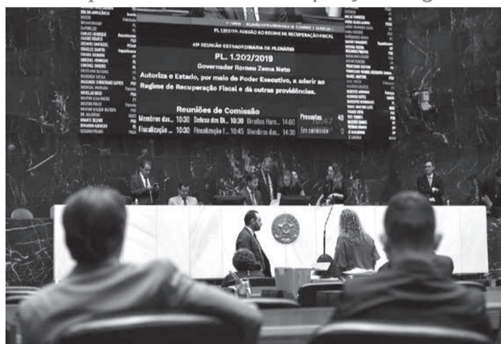
Parlamentares discursaram sobre os prejuízos que o RRF traria e questionaram a força do governo para aprovar o projeto

Ambas as matérias retornam agora à Comissão de Fiscalização Financeira e Orçamentária (FFO), para análise das modificações sugeridas. Reuniões com esse objetivo já foram marcadas para esta terça (12), às