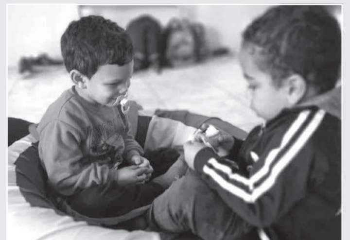
As doações de parcela do IRPF a projetos sociais, realizadas pela Cemig e seus empregados, beneficiaram cerca de 20 mil crianças e adolescentes em todas as regiões do estado

Fundos da Infância e do Adolescente (FIAs). Além disso, a companhia também complementa a destinação para a instituição escolhida pelo colaborador, ou seja, a entidade é beneficiada duas vezes.