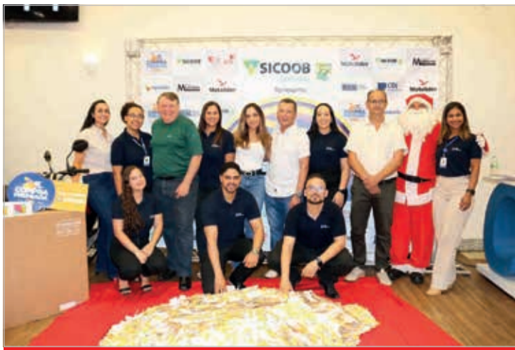
Equipe CDL com representantes do Sicoob Credivale