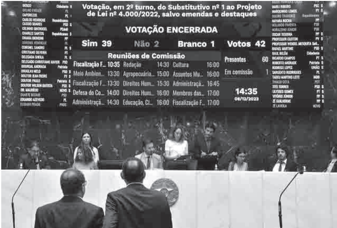
Proposta foi votada de forma definitiva pelo Plenário da Assembleia no dia 6 de dezembro

Trecho do texto aprovado pela Assembleia foi vetado pelo governador Zema