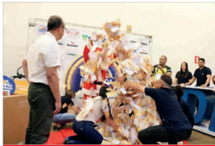
Sorteio de 41 prêmios na campanha Compra Premiada CDL