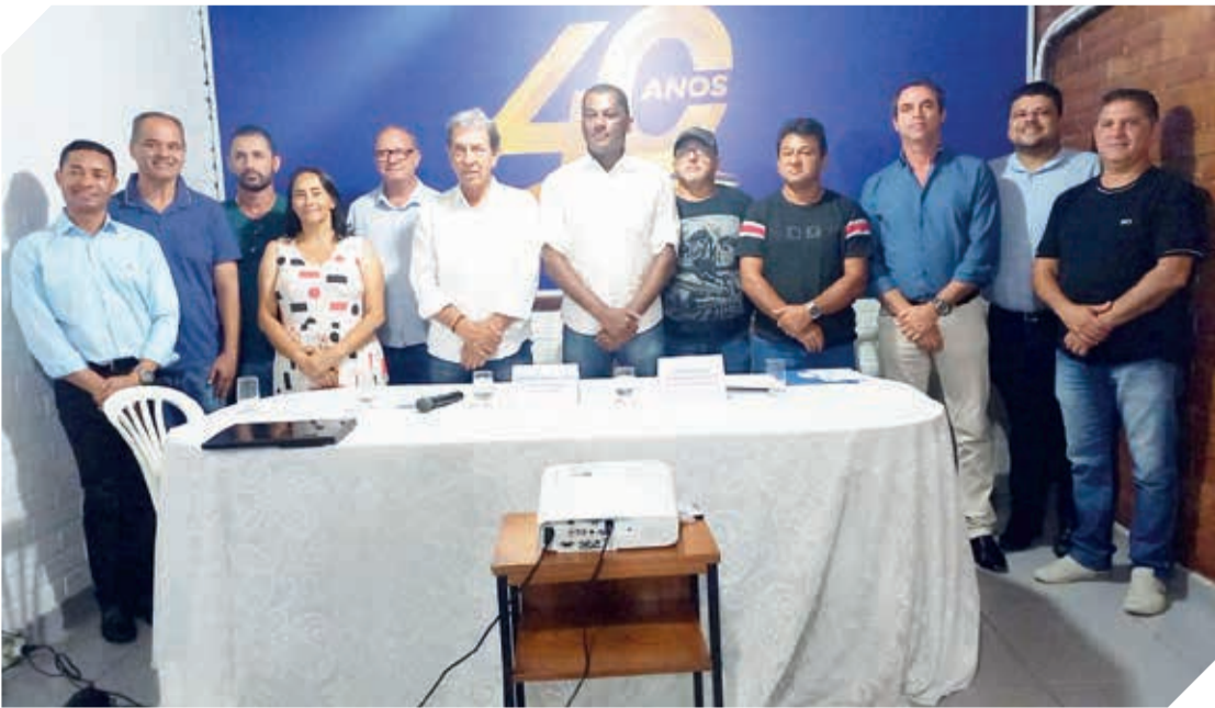
Após a eleição, foi feita a foto oficial dos prefeitos ou seus representantes legais