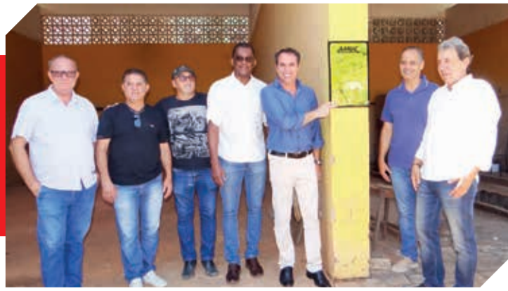
Instalação da placa onde será a sede própria da AMUC