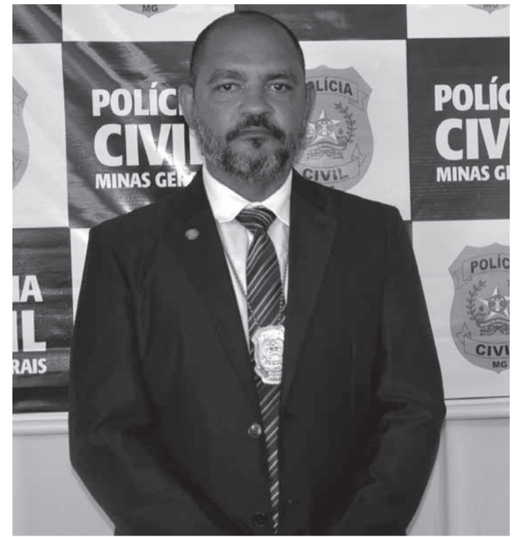
Polícia Civil investiga morte de mulher por enforcamento em Itambacuri

Valadares tem escolinhas da Estação Olímpica - A Prefeitura de Governador Valadares, por meio da Secretaria de Cultura, Esporte e Lazer, está com inscrições abertas para as escolinhas da Estação Olímpica. As aulas são gratuitas e voltadas para crianças e adolescentes de 7 a 17 anos. As modalidades oferecidas são: futebol, natação, natação paralímpica, atletismo e atletismo paralímpico. As aulas começam no dia 5 de fevereiro e serão realizadas de se-