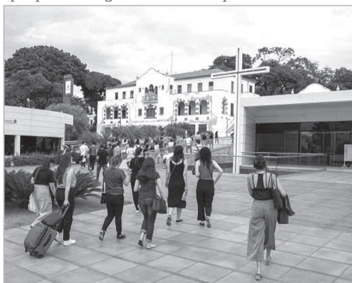
Candidatos compareceram no domingo (21) ao campus Coração Eucarístico da PUC Minas em Belo Horizonte