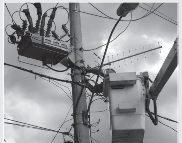
Entre os investimentos feitos pelo PDD, em expansão, modernização e reforma do sistema elétrico, a Cemig promoveu a construção e modernização de novas subestações (na foto 1 a SE Pequeri, na Zona da Mata) e linhas de transmissão, além de reforços nas redes de distribuição, como a instalação de religadores em diversas regiões do estado (foto 2)

das as sedes municipais, com realização de investimentos na expansão das redes de média e baixa tensão e na alta tensão.