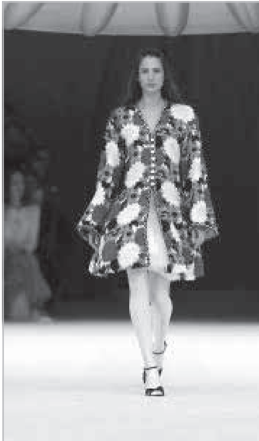
Chanel Armani Privé Valentino

ALTA-COSTURA O luxo sem complicações - A temporada de haute-couture em Paris teve como grande 'novidade' a roupa que (realmente) pode ser usada pelas mulheres. Isto é, as fantasias carnavalescas de luxo - habituais nos últimos desfiles - agora sumiram das passarelas.