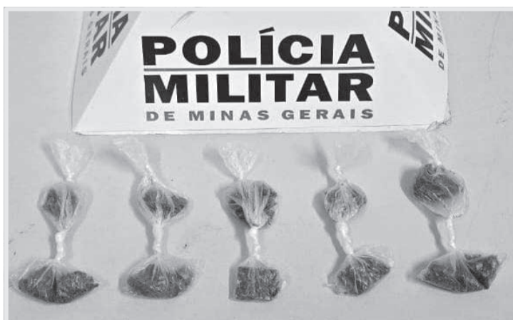
A PM realizou operação na segunda-feira (19) resultando na apreensão de quantidade expressiva de drogas e arma de fogo

volvimento em homicídios, contou com denúncias. “É uma resposta ao tráfico que a gente vem atuando de forma incisiva retirando essas pessoas de circulação. Mas o momento é de agradecer. Esse resultado não seria possível se não fosse a denúncia de cidadão daqui da cidade de Teófilo Otoni, que participou ativamente junto com a Polícia Militar”, frisou, afirmando que a PM não faz segurança de forma isolada, faz de forma participativa.