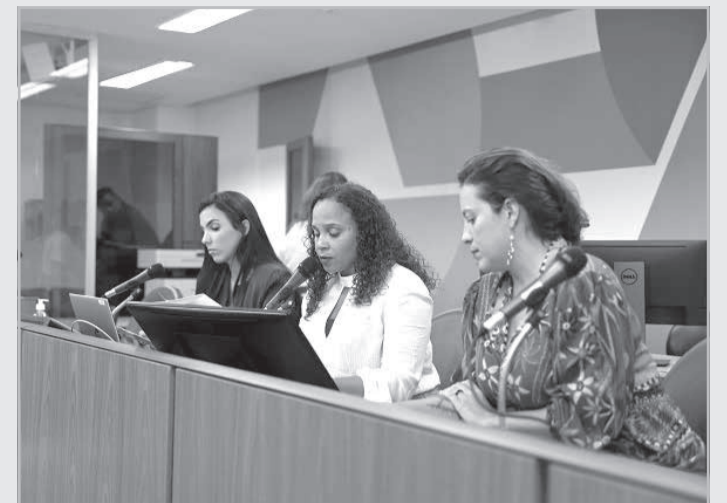
Aumento dos índices de violência contra mulheres foi citado na reunião como problema que exige ações intersetoriais

Articulação - Conforme o substitutivo, às mulheres vítimas de violência terão atendimento entre os serviços do Siste-