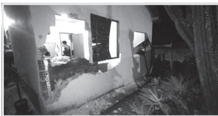
Os autores quebraram quase todo o imóvel e agrediram fisicamente a idosa de 73 anos