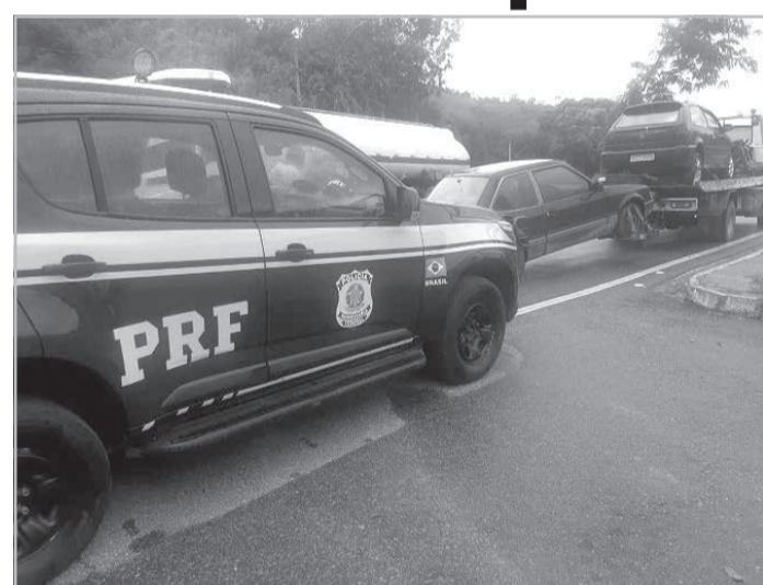
de prisão em aberto, oriundo de Caraguatatuba/SP, por homicídio, furto e receptação. Foram feitos os autos de infração cabíveis e o condutor foi encaminhado para a delegacia da Polícia Civil local para os procedimentos de polícia judiciária. (Informações/Foto: PRF Teófilo Otoni).

Os policiais constataram ainda, que o condutor não possuía CNH, e que constava contra ele um mandado