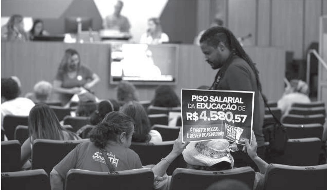
Representantes da categoria acusam a gestão do governador Romeu Zema de adotar uma estratégia para o sucateamento do serviço público

Comissão cobra recomposição integral para jornada estadual de 24 horas e nomeação de servidores para a educação básica