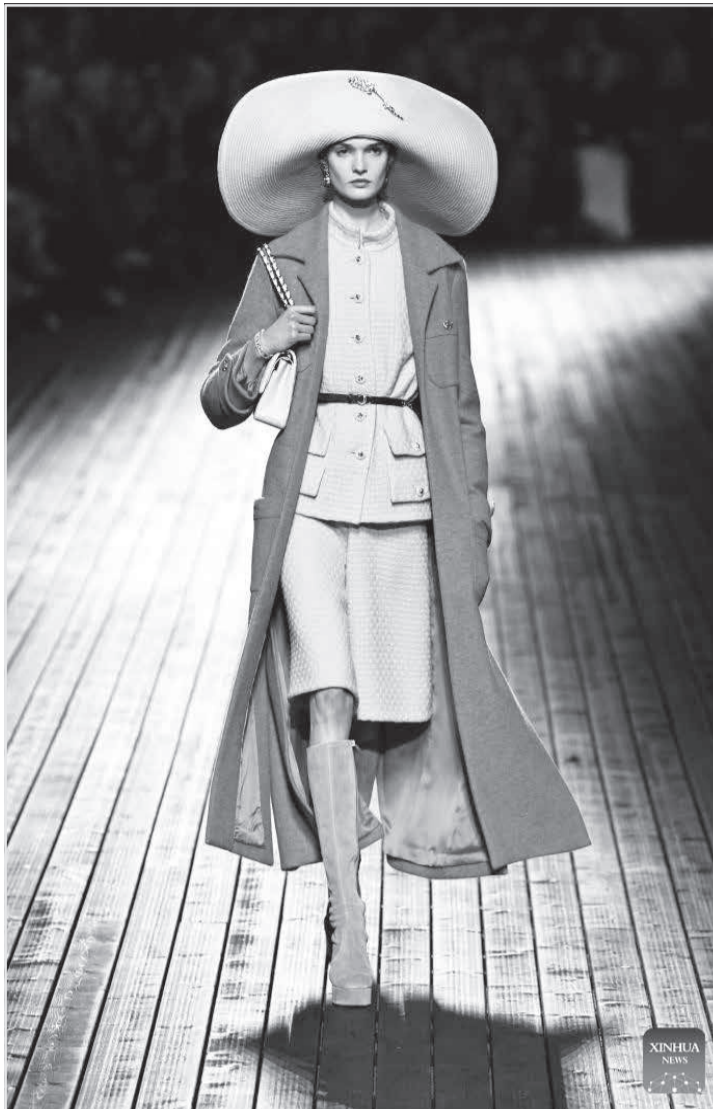
Desfile da Chanel Inverno de 2025

O circuito da moda mineira vive seu bimestre de ebulição, com a realização dos salões de moda. O próximo deles é o BH-a-Porter,