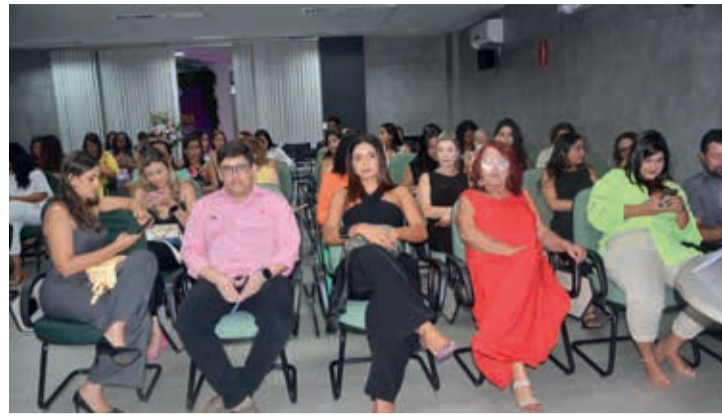
Mulheres que Lideram realizado no auditório Sicoob Credivale