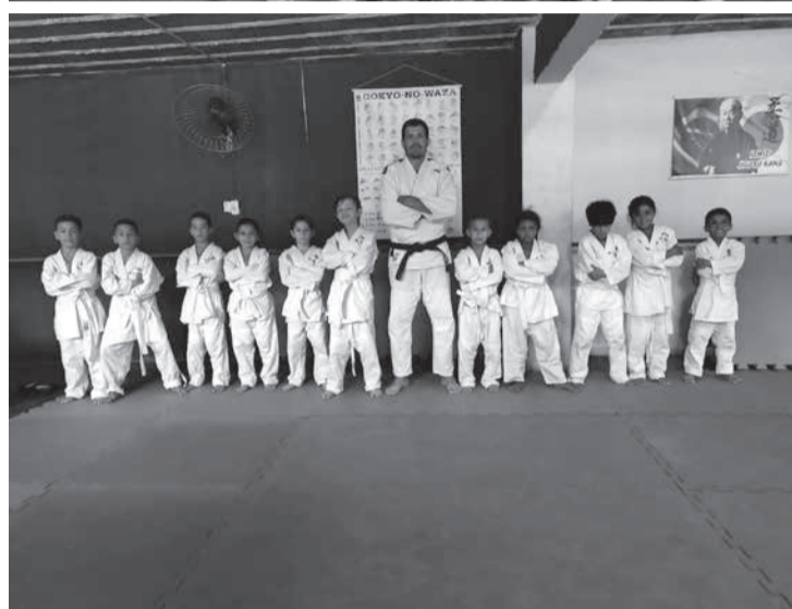
Ao todo, as "Olimpíadas que Transformam" vão reunir nove projetos patrocinados pela Cemig em Minas Gerais. A primeira etapa acontece em Governador Valadares, na Região Leste, no dia 11/03. Quem inicia a competição é o Projeto Argos, nas modalidades futsal e judô

utilizando o esporte como ferramenta de inclusão, transformação social e aos processos educacionais. Além disso, será uma excelente oportunidade de promover intercâmbio e novas experiências entre os participantes por meio da competição", afirma.