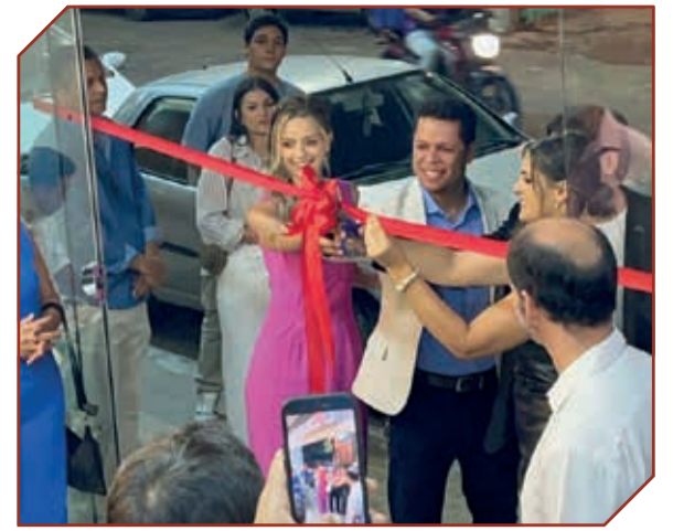
Inauguração da Odonto Tallents em Teófilo Otoni