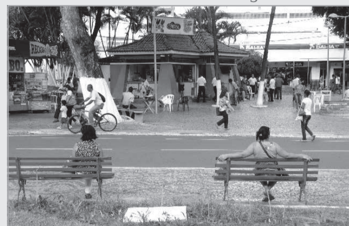
Teófilo Otoni recebe o terceiro encontro regional do Sempre Vivas, que debate a valorização da mulher

O Sempre Vivas é uma iniciativa da Assembleia Legislativa de Minas Gerais (ALMG) realizada todos os anos, por meio da Comissão de Defesa dos Direitos da Mulher. Em 2024, além dos eventos ocorridos na capital, a programação inclui quatro encontros no interior: em Divinópolis e em Poços de Caldas, realizados respectivamente em 15 e 18/3, em Teófilo Otoni, nesta sexta (22), e em Diamantina, no dia 25 de março.