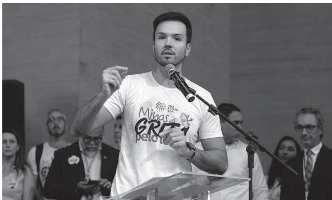
Presidente Tadeu Martins Leite disse que a Assembleia Legislativa de Minas Gerais está ao lado dos produtores rurais nessa mobilização

Ao discursar no evento, o presidente da Assembleia destacou se tratar de um movimento não só em defesa do leite, mas do Estado em si, já que Minas lidera o segmento no País, e disse que a Assembleia estará ao lado do setor nos encaminhamentos necessários. "Estamos aqui em defesa não só do leite, mas na defesa de Minas Gerais. Setenta por cento, esse foi o aumento das importações de leite praticamente num só ano no Brasil. E só esse fato já justifica um movimento importante como este. Mas nós ainda estamos falando da principal bacia leiteira do nosso País, e da importância