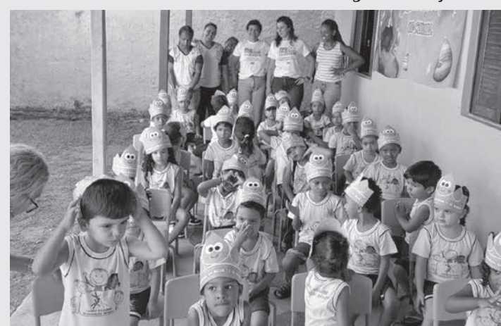
Alunos do Centro Solidário de Educação Infantil, anexos I e II, em Teófilo Otoni

e professores acerca dos cuidados com a água e o meio ambiente, mas traz também satisfação pessoal. “É muito gratificante ver o brilho nos olhos dessas crianças que fazem perguntas. Compartilhar esse conhecimento me deixa alegre ao perceber que elas compreenderam o que foi ensinado”, disse.