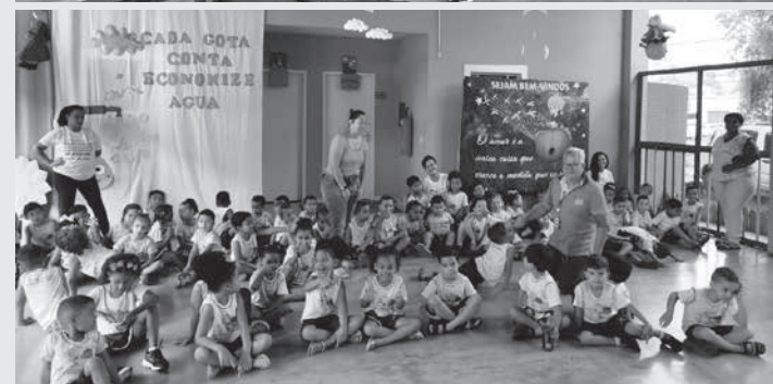
Alunos do Centro Solidário de Educação Infantil, em Teófilo Otoni