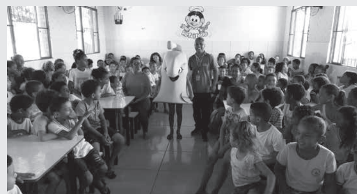
Alunos da Escola Estadual Carlos Magno Rebouças