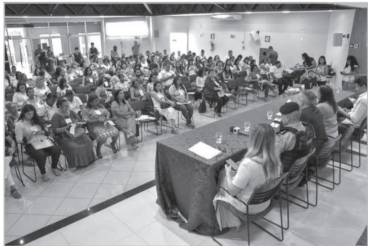
Cidade é considerada pioneira na ação integrada contra a violência de gênero

O enfrentamento inclui uma rede de órgãos de proteção, que trabalham em conjunto e contam com sistema de informações inédito