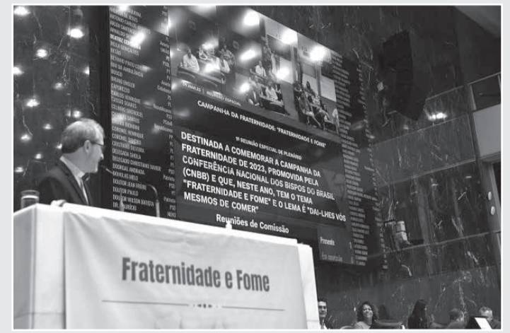
Em 2023, a Assembleia de Minas realizou Reunião Especial para celebrar a Campanha da Fraternidade