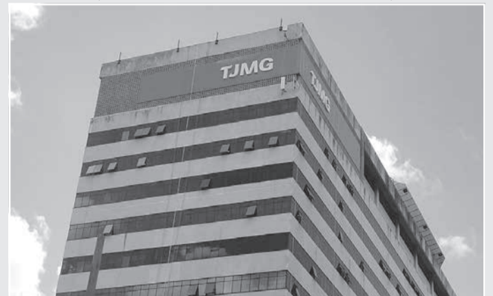
O calendário do Mutirão do Júri já está definido nas comarcas de Águas Formosas, Teófilo Otoni, Januária e Unaí

Mutirão do Júri da Comarca de Belo Horizonte, nos meses de julho e novembro de 2023, com a realização de 307 sessões de julgamento, a Presidência do TJMG está voltando suas ações para as comarcas do interior, a fim de que os processos de crimes dolosos contra a vida possam ter prioridade no Programa de Cooperadores”, afirmou.