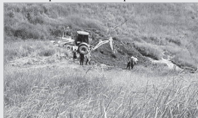
Buscas à procura dos dois desaparecidos, em estrada na zona norte de Teófilo Otoni