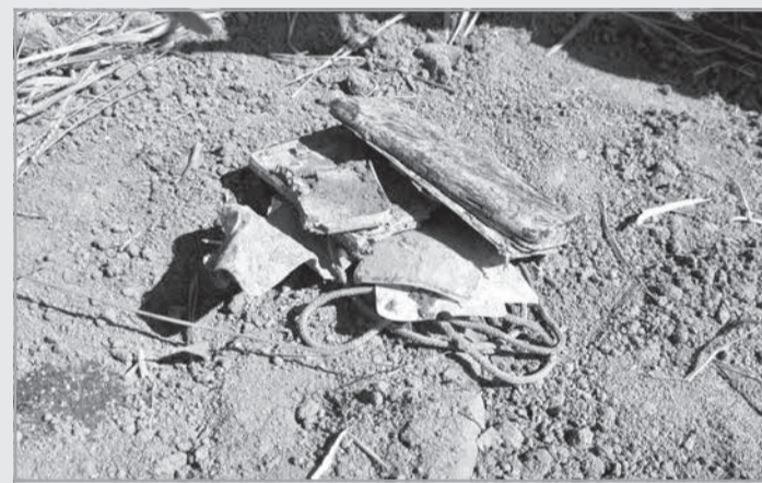
Nas buscas foram encontrados 2 celulares que podem ser dos dois desaparecidos