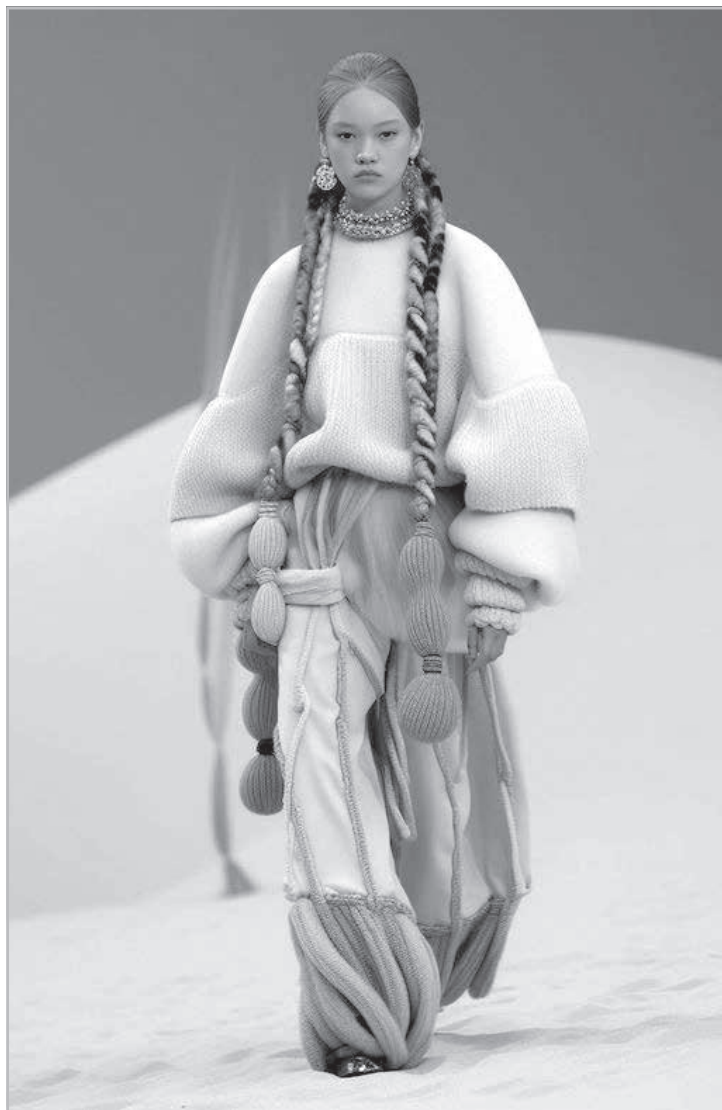
Modelo criado por IA pela Maison Meta

>O mês de abril será o mais fashion do primeiro semestre no circuito Minas / São Paulo. A saber: no dia 15, em Beagá, se-