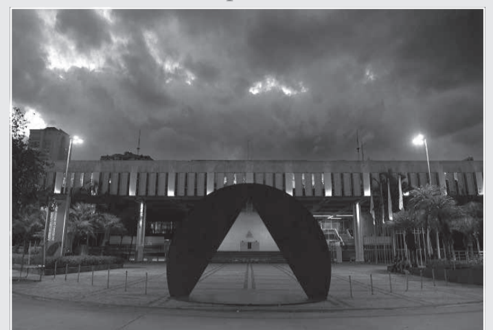
Desta terça (2), Dia Mundial de Conscientização sobre o TEA, até a próxima segunda-feira (8), o Palácio da Inconfidência terá iluminação especial reforçando o Abril Azul

O Brasil ainda não tem estudos e pesquisas sistemáticas para levantamento da quantidade de pessoas com TEA, mas segundo o Centro de Controle e Prevenção de Doenças dos