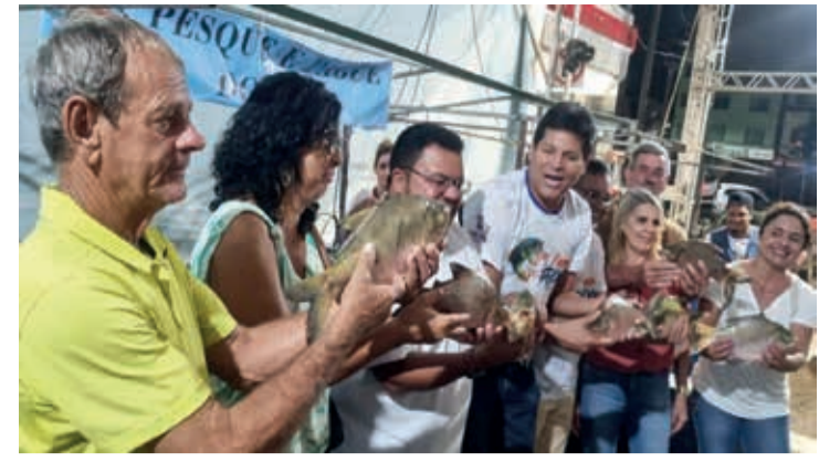
Comercialização de peixes vivos e vários outros produtos