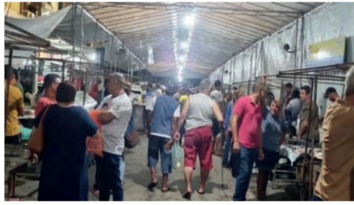
O evento aconteceu na área central, próximo à rodoviária