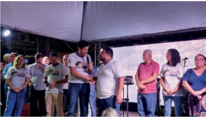
Abertura oficial da 29ª Feira do Peixe em Teófilo Otoni