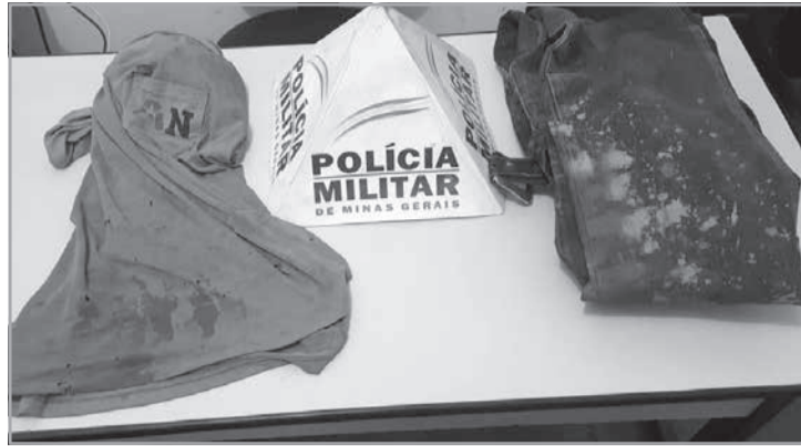
A Polícia Militar apreendeu um telefone celular e 2 vestimentas com manchas de sangue

Os militares fizeram diligências no povoado de Jenipapinho, e após levantar algumas informações e realizar diversos