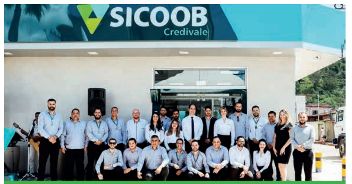
Equipe Sicoob Credivale

A presença e apoio desses ilustres líderes e membros