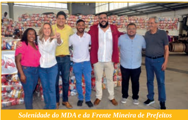
Solenidade do MDA e da Frente Mineira de Prefeitos