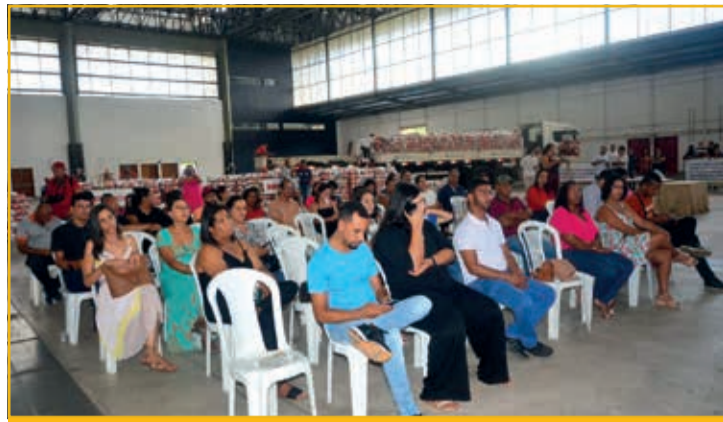
Solenidade para a entrega das cestas realizada no Expominas