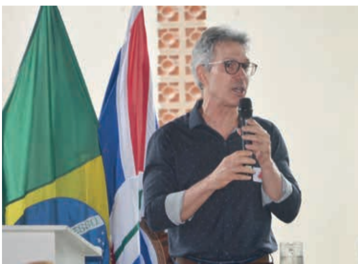
Solenidade de posse teve a presença dos governadores: Romeu Zema (Minas Gerais) e Ronaldo Caiado (Goiás)