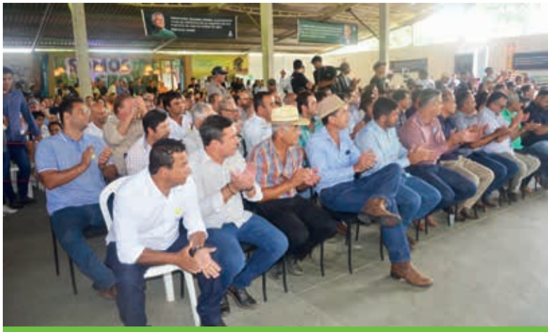
Presença de diversas autoridades de Carlos Chagas e região