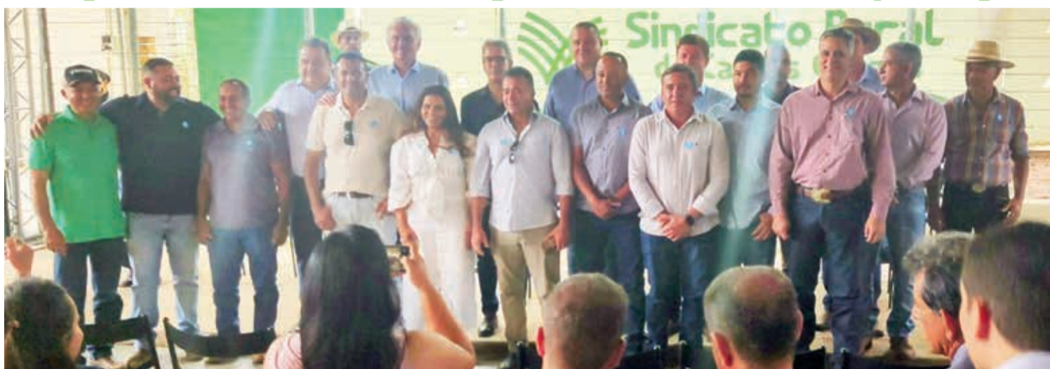
Solenidade de posse da Diretoria, Conselho Fiscal e Suplentes da ASPROVALES, no Parque de Exposições de Carlos Chagas

Um dia histórico para os Vales do Mucuri, Jequitinhonha e São Mateus, com a posse por 24 sindicatos de produtores rurais, que representam 56 municípios, e com as