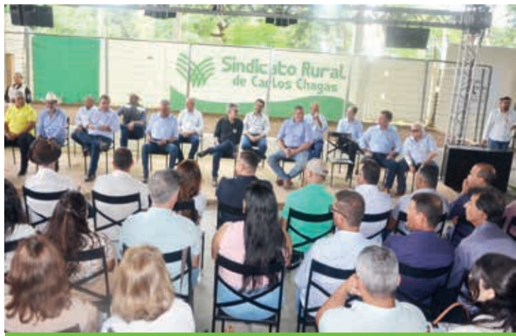
Solenidade realizada no Parque de Exposições de Carlos Chagas