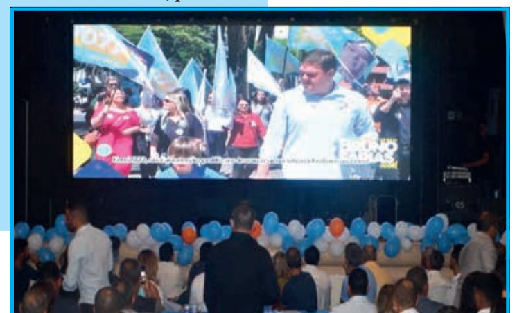
Durante o evento foram apresentadas as ações do Deputado Federal Bruno Farias até o momento