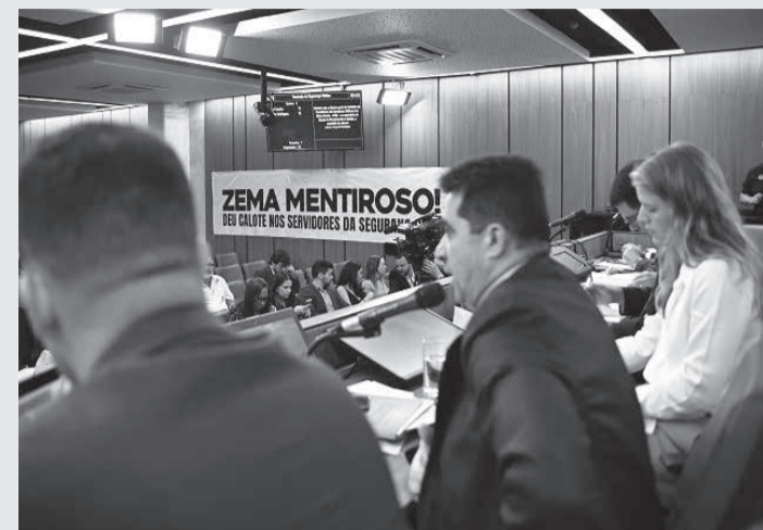
Deputados e servidores das forças de segurança pública contestaram as explicações do governo de Minas para a interrupção do repasse patronal para o IPSM

O IPSM era sustentado com a contribuição de 8% dos vencimentos dos militares beneficiários e de mais 16% de contribuição patronal, conforme determina a Lei 10.366, de 1990. No entanto, a Lei Federal 13.954, de 2019, suspendeu a contribuição patronal, assim como estabeleceu o aumento da