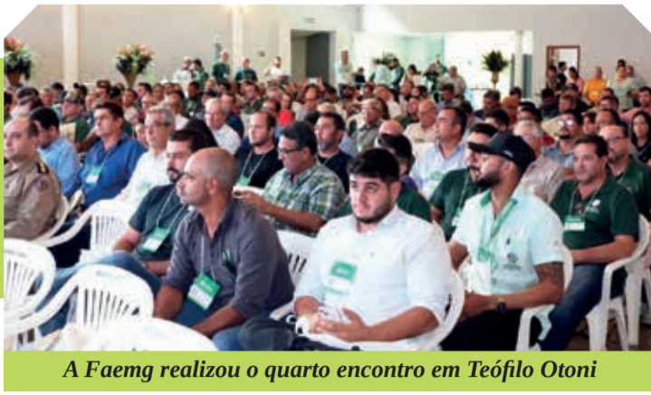
A Faemg realizou o quarto encontro em Teófilo Otoni