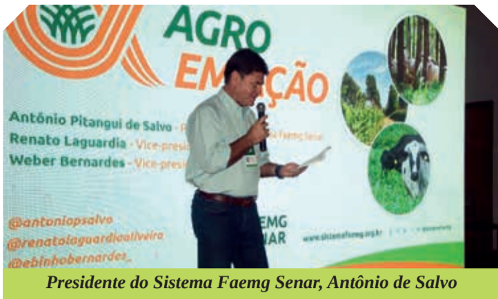
Presidente do Sistema Faemg Senar, Antônio de Salvo