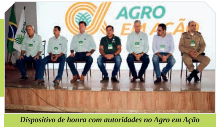
Dispositivo de honra com autoridades no Agro em Ação