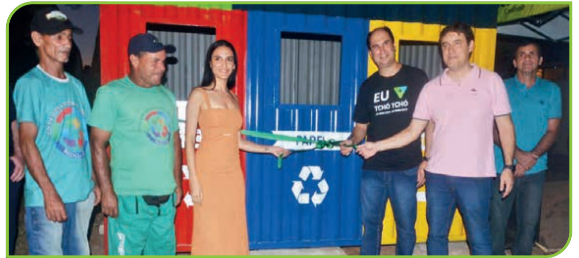
Corte da fita inaugural do EcoPonto instalado na praça do bairro Ipiranga

“Esse é nosso objetivo, melhorar a cidade e em parceria tudo fica mais fácil”. Ressalta-se que o Sicoob tem realizado muitas ações voltadas para o lado social, nas cidades onde tem agências. Em Teófilo Otoni, sua sede, tem a educação financeira nas escolas, coral com crianças que estão aprendendo a to-