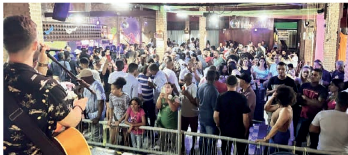
O encontro reuniu mais de 500 Ladainhenses num clima de grande confraternização

“É uma cidade coimã que há mais de 50 anos tem esse laço de amizade uma conexão muito forte. A maioria de Ubatuba foi construída pe-