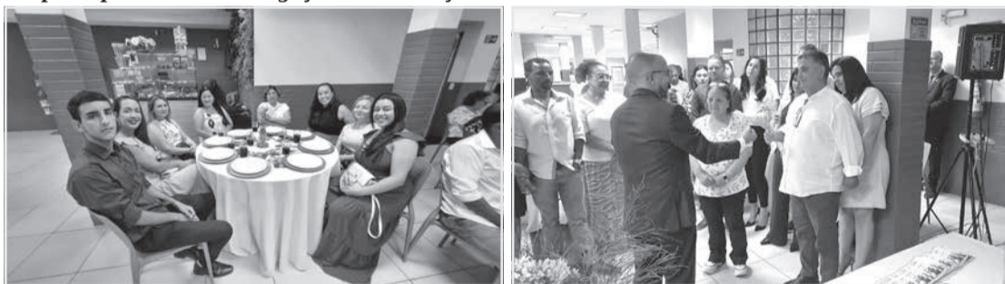
Dezenas de pessoas participaram do jantar e se emocionaram com as palavras do conferencista