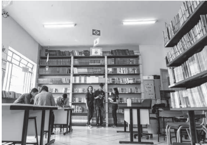
Nos últimos três anos, as ações educacionais da Cemig levaram informações sobre como economizar energia para mais de 300 mil alunos em todo estado. Além disso, foram substituídas, nos últimos anos, milhares de lâmpadas em escolas públicas de Minas Gerais

Uma importante instituição beneficiada pelo PEE da Cemig foi a Universidade Federal de Ouro Preto (UFOP), que recebeu investimentos de, aproximadamente, R$ 1,5 milhão na Chamada Pública de Eficiência Energética. A UFOP foi contemplada com a modernização da iluminação externa em quatro locais: Campus Ouro Preto, Campus João Monlevade e Campus de Mariana (Instituto de Ciências So-