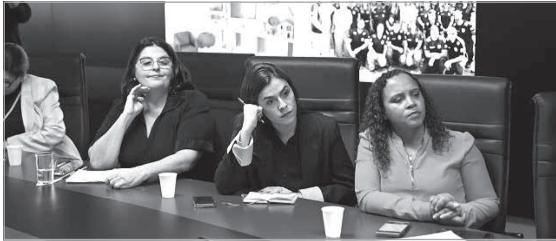
Para as deputadas, criação de instância poderá agilizar encaminhamentos para o enfrentamento à violência contra a mulher; Minas está entre os estados onde há mais mortes por feminicídio

Demanda foi apresentada em reunião realizada a pedido da bancada feminina da Assembleia Legislativa para discutir na corporação o enfrentamento à violência de gênero