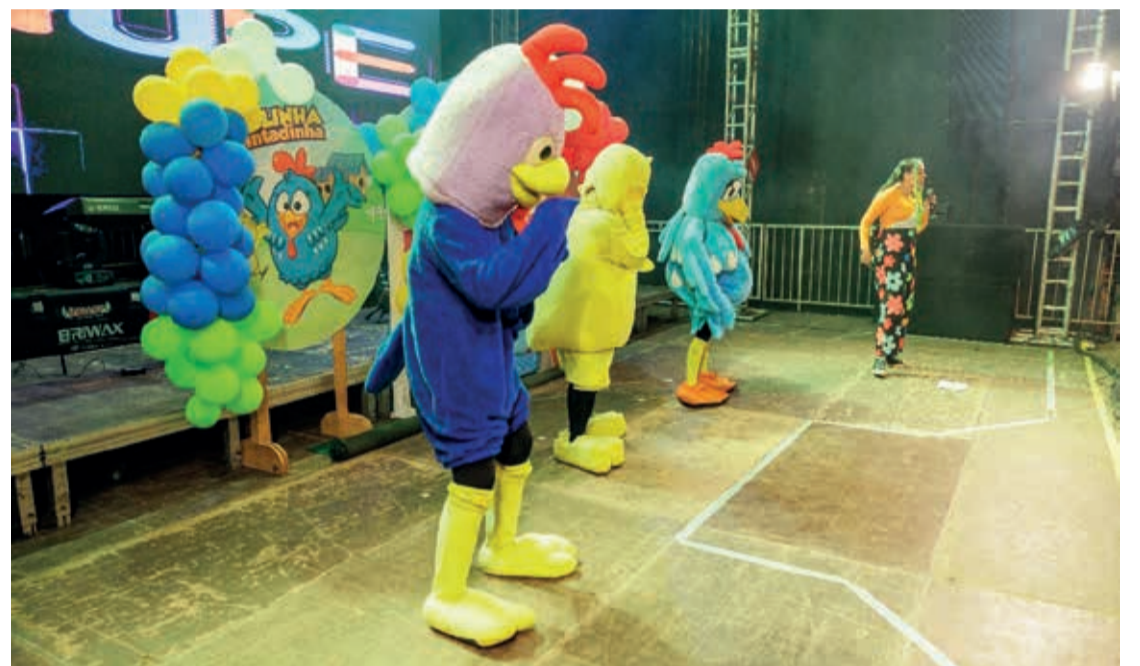
Patati Patatá Cover e Galinha Pintadinha, animação infantil na tarde de domingo

Para o prefeito, é preciso trabalhar muito e fazer obras, mas não se pode perder esses momentos culturais, as tradições, as cavalgadas, que são muito importantes também para a população. O município é composto por 70% de zona rural. Ressalta-se que a festa movimenta significativamente o comércio, pois são hotéis e pousadas ocupadas, bares e restaurantes movimentados, oportunidades dos trabalhos informais, que muita gente já aguarda essas datas para um trabalho extra. A locução do evento ficou por conta de Vanilson Souza, Valdênio Farias e Átila Marciel. (Fotos: assessoria de comunicação da Prefeitura de Ladainha).