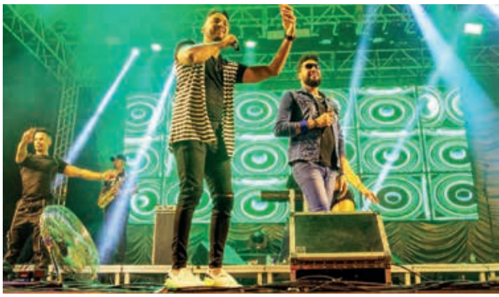
Banda Forró Boys se apresentou na sexta-feira