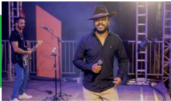
Show com o cantor Patrício Rodrigues