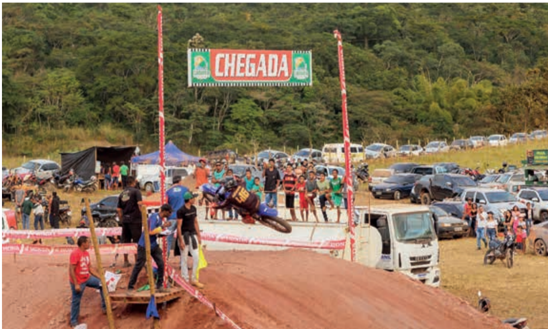
Na manhã de domingo teve o Motocross com muita adrenalina e manobras radicais