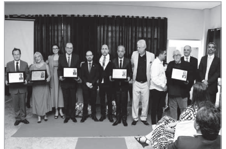
Título de cidadão honorário concedido pela Câmara Municipal de Itaobim