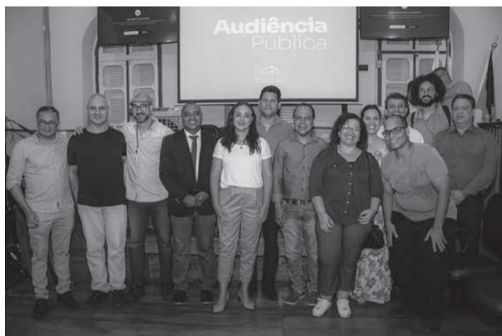
Audiência Pública realizada em Teófilo Otoni, dia 23/10/2023, debateu a emancipação do Campus Mucuri da UFVJM