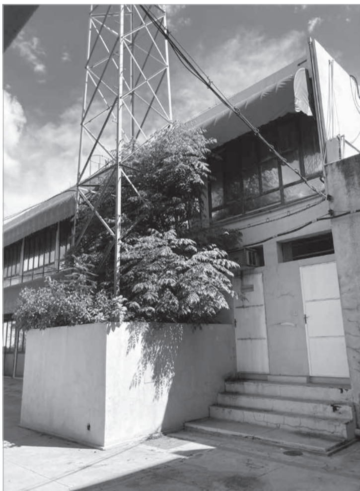
A Cemig vai promover um leilão para ofertar 36 propriedades em 18 municípios de Minas, localizados em diversas regiões. Nas fotos, imóvel colocado à venda em Montes Claros, no Norte de Minas

bém estão sendo ofertados sete imóveis com valores variando de R$ 97.900,00, por uma sala comercial em Divino, a R$ 1.690.640,00, por um prédio comercial em Nanuque. Foram incluídos no leilão, imóveis localizados em Minas Novas e Braúnas, também no Leste de Minas. Na Zona da Mata, está sendo ofertado um terreno rural em Piau, com 41,32 hectares, no valor ofertado de R$ 579.000,00. E, na região Oeste do estado, está sendo anunciado um lote urbano com 482 m 2 de área em Iguatama, com lance mínimo de compra de R$ 20.400,00.