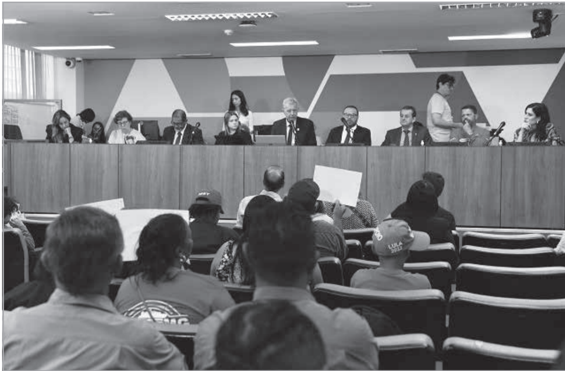
Chacina de Unai também foi lembrada em reunião, em que concurso para auditores e pedido de CPI sobre situação nas lavouras foram destaques

Áudio que incitaria uso de armas contra fiscalização de lavouras de café e discurso que incentivaria violência no campo são divulgados em reunião, na Assembleia de Minas