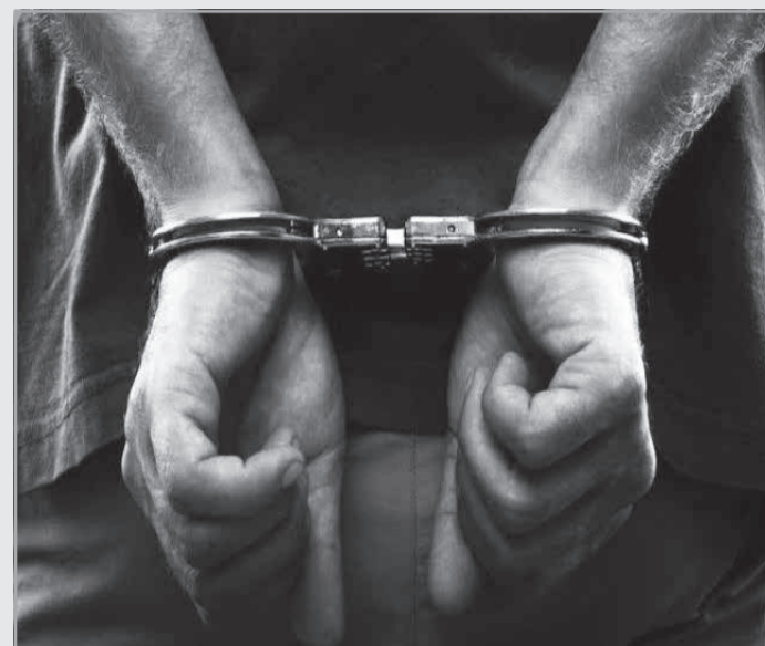
Crime ocorreu no bairro Filadélfia, em Novo Cruzeiro

A vítima tentou retornar para dentro da residência no momento dos disparos, mas foi alvejado por quatro tiros e caiu na sala. No local foram encontradas diversas cápsulas de calibre 9mm. Durante as diligências, os policiais receberam diver-