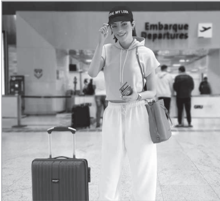
A Lu da Magalu

E mais: com a mudança, a companhia prevê um avanço da monetização da influenciadora virtual. A versão atualizada foi apresentada nas redes sociais do Magalu nesta semana. A ação será desdobrada com um desafio no Tiktok, convidando o público a mostrar por que ser humano é mais divertido do que ser virtual. No fim do ano passado, "Lu do Magalu", trabalho criado pela Ogilvy Brasil para Magazine Luiza, foi premiado pelo Global Best of the Best do Effie Worldwide.