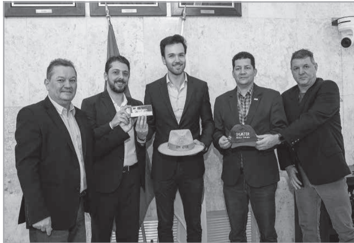
Diretores da empresa foram à Assembleia levar a premiação

O prêmio é concedido pela Emater-MG a personalidades que se empenharam na promoção do desenvolvimento rural sustentável de Minas e na melhoria da qualidade de vida no campo e nas cidades. Os homenageados pelo prêmio são agraciados com a entrega da miniatura do Jeep Dourado, veículo que caracteriza as ações da Emater-MG em Minas Gerais, desde o início de suas atividades, em 1948. A Emater-MG é a maior empresa pública do setor no Brasil e atualmente está presente em cerca de 800 municípios do estado, sen-