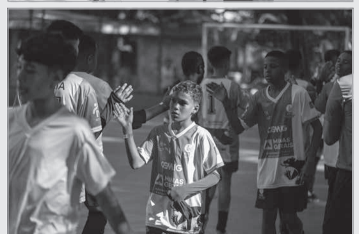
Nas fotos, crianças que participaram, recentemente, da 1ª edição das Olimpíadas que Transformam, competição que reuniu nove projetos esportivos patrocinados pela companhia via Lei de Incentivo ao Esporte

desenvolver talentos esportivos e promover valores como cidadania e respeito mútuo. Para a comunidade, os projetos esportivos patrocinados pela Cemig representam uma importante ferramenta de resgate social e cidadania, beneficiando especialmente crianças e adolescentes, além de outros públicos diversos", comentou. Mais detalhes sobre o cadastro dos projetos de esporte no edital da Cemig podem ser obtidos no site da Companhia. Dúvidas sobre o edital e/ou formulário de inscrição dos projetos esportivos podem ser enviadas para o e-mail esporte@cemig.com.br.