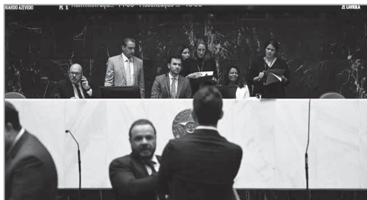
O diálogo com diferentes setores sociais e correntes políticas pautou os trabalhos do 1º semestre no Parlamento Mineiro

Crise climática é pauta prioritária - As secas severas e as chuvas torrenciais vêm se tomando cada vez mais frequentes e intensas, não apenas em Minas Gerais, mas em todo o mundo. No início do ano, a ALMG assumiu o compromisso de discutir tecnicamente a pauta da crise climática no Estado, bem como fomentar projetos de inovação tecnológica e propor uma agenda de trabalho legislativo sobre o tema. O Seminário Técnico Crise Climática foi lançado em março, com um debate com a participação de autoridades e especialistas. Pesquisadores alertaram que, em 70 anos, a temperatura pode aumentar até seis graus em Minas Ge-