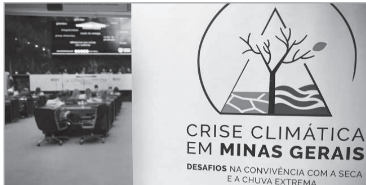
Em março, teve início o Seminário Técnico Crise Climática em Minas Gerais, cuja etapa final será em agosto

ras, o que traria prejuízos significativos para a agricultura.