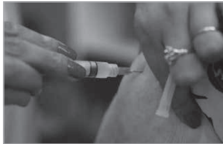
Vírus da gripe circula de maneira heterogênea pelo país, mostra Fiocruz, em recente boletim InfoGripe