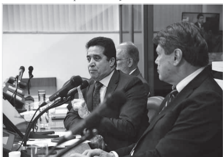
Comissão de Segurança Pública da Assembleia Legislativa de Minas se reuniu na terça (13) e apresentou o substitutivo nº 3 ao projeto

Mudanças na tramitação - Primeira a analisar o projeto, a Comissão de Constituição e Justiça (CCJ) aumentou o escopo do cadastro, para conter dados não