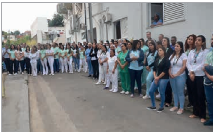
Colaboradores do Santa Rosália participando da solenidade