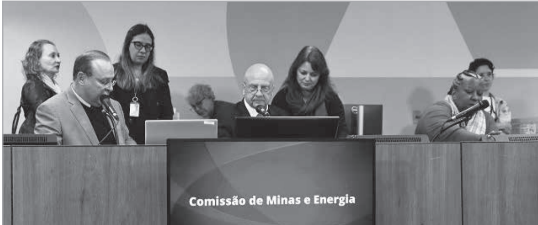
Comissão de Minas e Energia

O projeto estabelece que o Estado desenvolverá programas e ações para incentivar a aquisição de sistemas de captação e armazenamento de energia solar