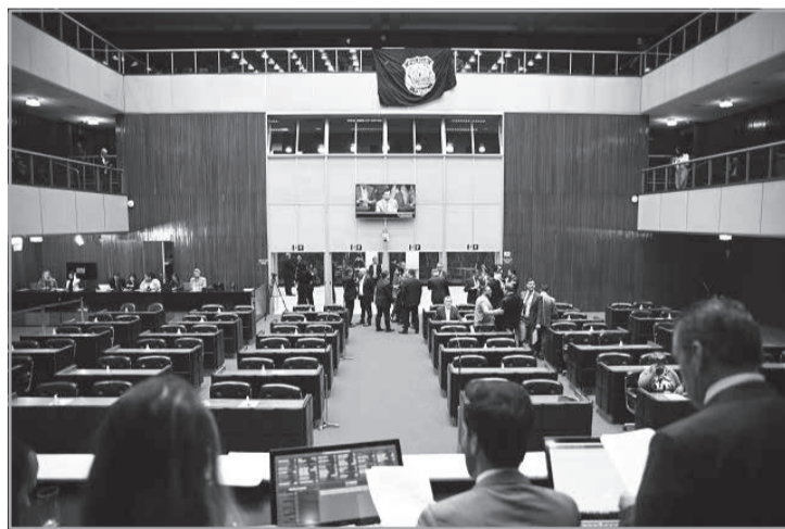
PL aprovado determina inclusão no cadastro de autores de crimes contra a vida, lesões corporais, ameaça e crimes contra o patrimônio praticados mediante violência

De autoria do deputado Bruno Engler (PL), o texto foi votado na forma de um novo texto (substitutivo nº 1) apresentado pela Comissão de Segurança Pública, em sua análise de 2º turno, ao conteúdo que passou pelo Plenário em 1º turno com modificações (vencidas). Também foram acatadas as emendas nºs 1 e 2 do deputado Sargento Rodrigues (PL), apresentadas durante a fase de discussão da proposição nesta quarta (28) e apreciadas independentemente de parecer por meio de acordo dos líderes.