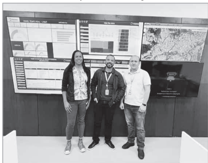
Equipe do cadastro da Unidade de Serviço Comercial da Copasa

intendente elencou as principais, como a geração de religação automática para os clientes cujos débitos já foram pagos, sem a necessidade de buscar o atendimento nos canais de relacionamento. Leitura e confirmação obrigatórias, em campo, de imóveis com abastecimento interrompido. Cancelamento das retiradas dos hidrômetros das ligações em alguns tipos de serviços e ações de cobranças, o que permitirá fiscalizações mais efetivas de fraudes, bem como a instalação desse aparelho em todas as ligações que estiverem sem medidor, seja por motivo de supressões ou taponamentos, por exemplo.