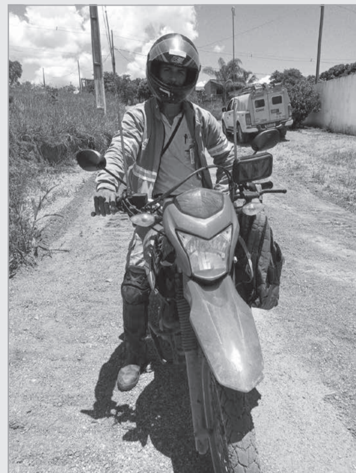
Para cobrir uma área de concessão que abrange 774 municípios e mais de 540 mil km de redes de distribuição, a Cemig possui 528 leituristas motociclistas, que atuam principalmente nas áreas rurais de Minas Gerais

Em média, cada um desses profissionais roda mais de 2 mil quilômetros por mês, o que significa que toda a força de trabalho nesta função roda mais de 1,3 milhão de km a cada 30 dias, ou seja, algo equivalente a mais de 30 voltas no planeta Terra. Por isso, especialmente no período seco, a população precisa ficar atenta a situações que podem provocar acidentes graves com