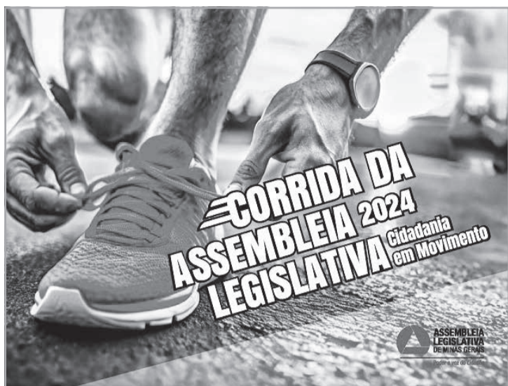
Em 2024, a Corrida da Assembleia ganha novos formatos e tema: Cidadania em Movimento

Pessoas com Necessidades Especiais (PNE) largarão antes do pelotão principal, com exceção do grupo do