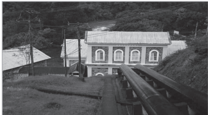
A UHE Marmelos, em Juiz de Fora, é uma das unidades que compõem o lote contemplado no Edital de alienação

alienação. Além disso, o valor do depósito em conta vinculada, que deverá ser feito pelo vencedor da licitação, foi reduzido para 10% do preço, na assinatura do contrato de transferência onerosa do direito de exploração das usinas. A complementação será feita por Garantia de Fiel Cumprimento, no valor de 90% do preço.